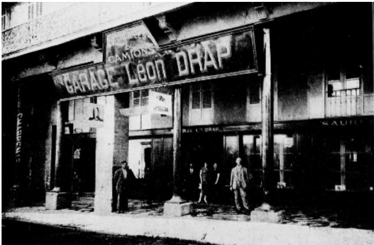
Façade du garage Léon Drap, rue Nationale.

CONSTANTINE Le Garage Léon Drap ( L'Afrique du Nord illustrée , 31 décembre 1927)