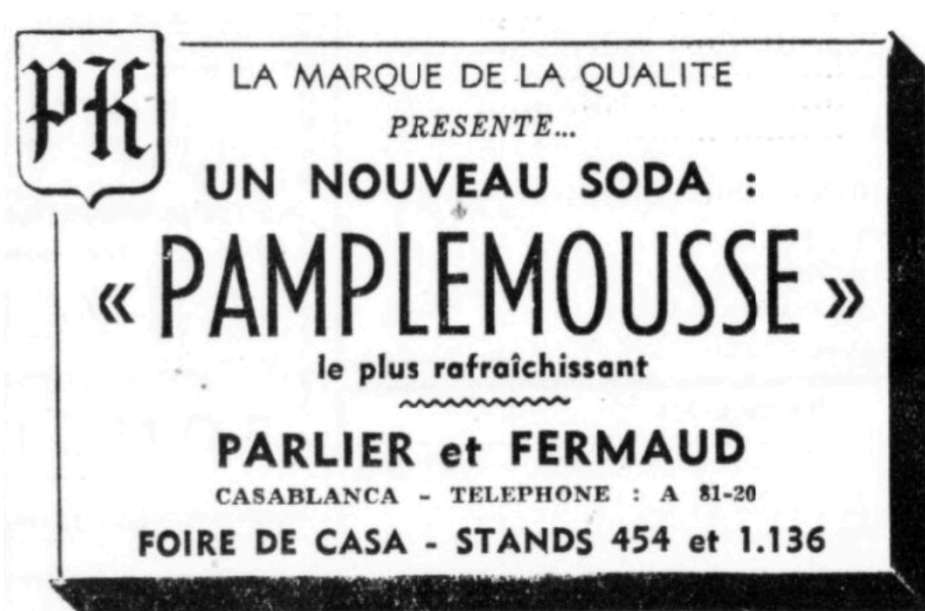
Nouveau soda Pamplemousse

Publicités ( La Vigie marocaine , 25 juillet-5 août 1949)