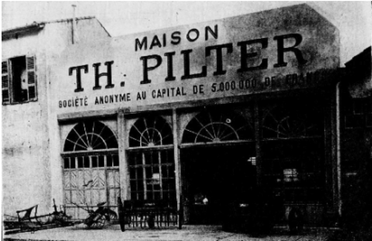
Le hall d'exposition de la maison Th. Pilter (capital : 5 MF) à Bône.

MAISON Th. PILTER PLACE D'HIPPONE, BÔNE ( L'Afrique du Nord illustrée , 12 février 1927)