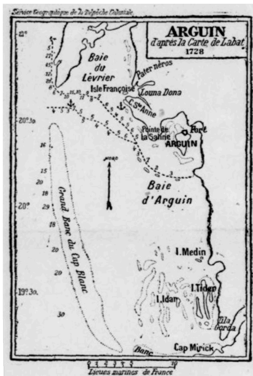
ARGUIN d'après la carte de Labat (1728) en lieues marines de France

ÉTUDE HISTORIQUE ET GÉOGRAPHIQUE ( La Dépêche coloniale , 14 novembre 1903)