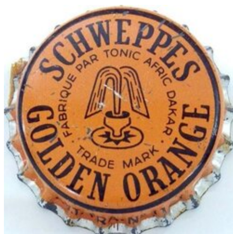
Schweppes Golden Orange