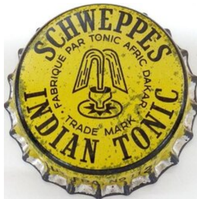
Schweppes Indian Tonic