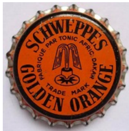
Schweppes Golden Orange