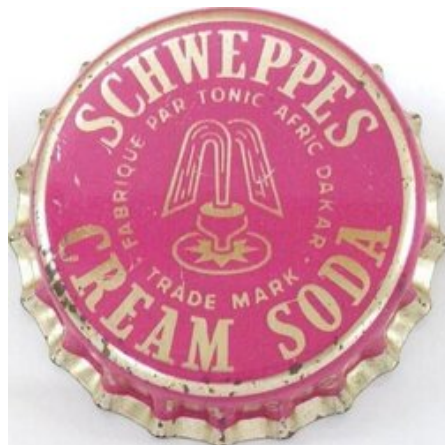
Schweppes Cream Soda