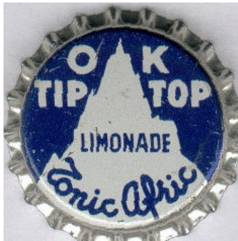
OK Tio Top Limonade