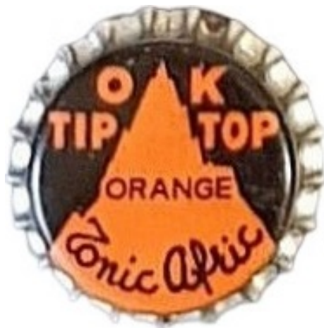
OK Tip Top Orange