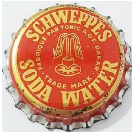
Schweppes Soda Water