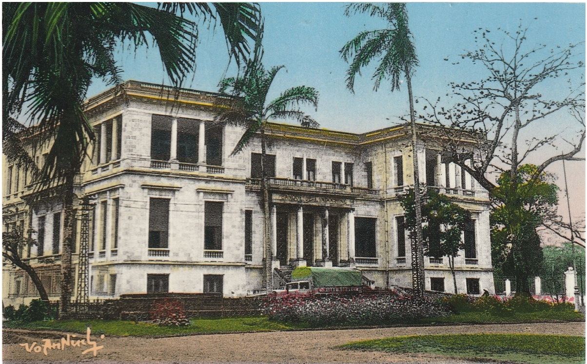
Haiphong. — La Banque de l'Indochine.