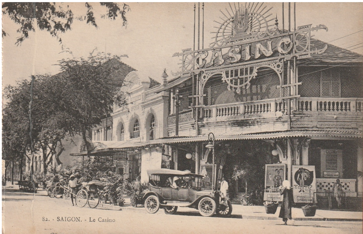
82. - SAIGON. - Le Casino