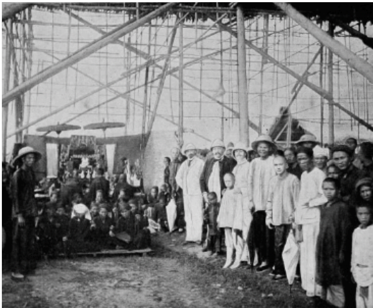
Montage des chaudières à vapeur de la filature de coton, à Haïphong, le 25 septembre 1899.

[313] horizontale compound, système Corliss, dont les deux cylindres ont respectivement 0 M. 56 et 1 mètre de diamètre, avec une course commune de 1 m. 22.