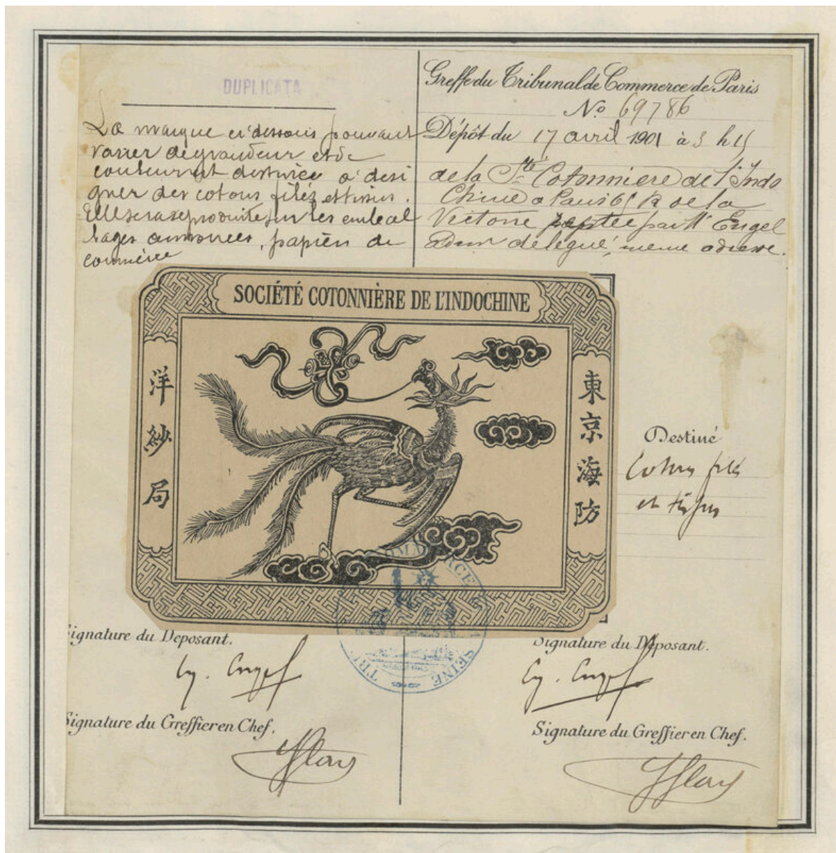
Dépôt de la marque de fabrique au greffe du tribunal de commerce de Paris, 17 avril 1901. Archives de l'Institut national de la propriété industrielle

Les filés d'Haiphong valaient 15 piastres la balle de 180 kg, prise à l'usine, en novembre dernier.