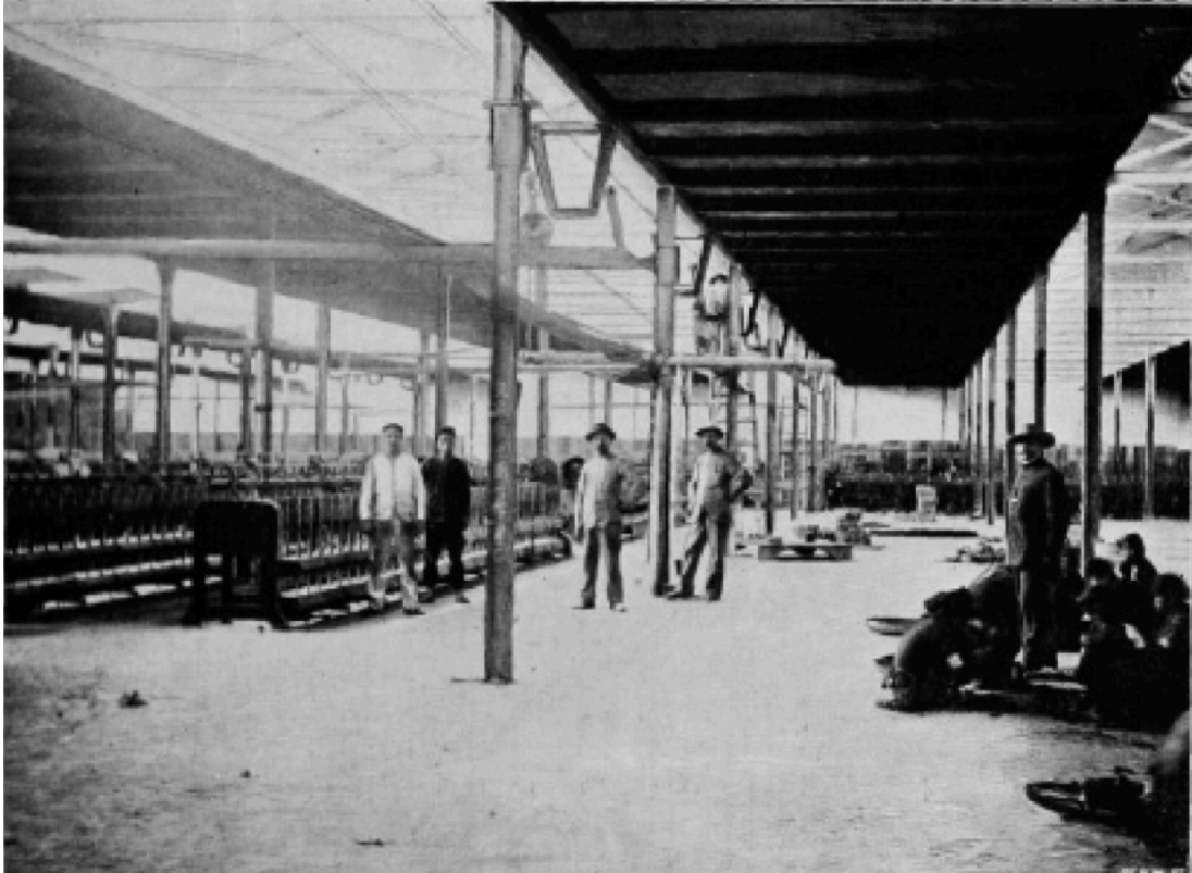
Vue d'une des salles de machines de la filature au 31 décembre 1899.

L'eau d'alimentation, avant d'arriver aux chaudières, traverse un réchauffeur constitué par une batterie de 288 tubes. L'élévation de la température de l'eau est produite par les gaz de la combustion, qui passent à travers le réchauffeur avant de s'échapper par la cheminée.