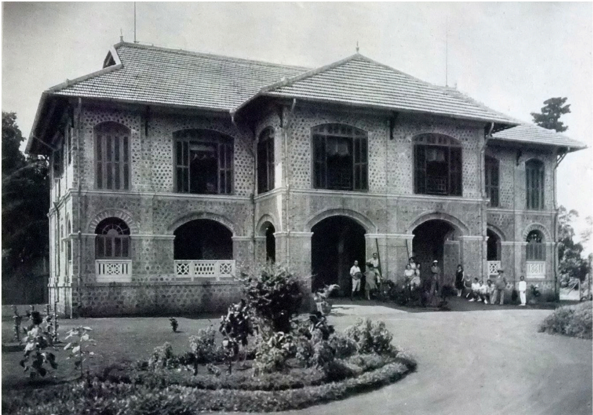
Maison d'habitation du directeur (Pl. 68) ( Annuaire du Syndicat des planteurs de caoutchouc de l'Indochine , 1931)