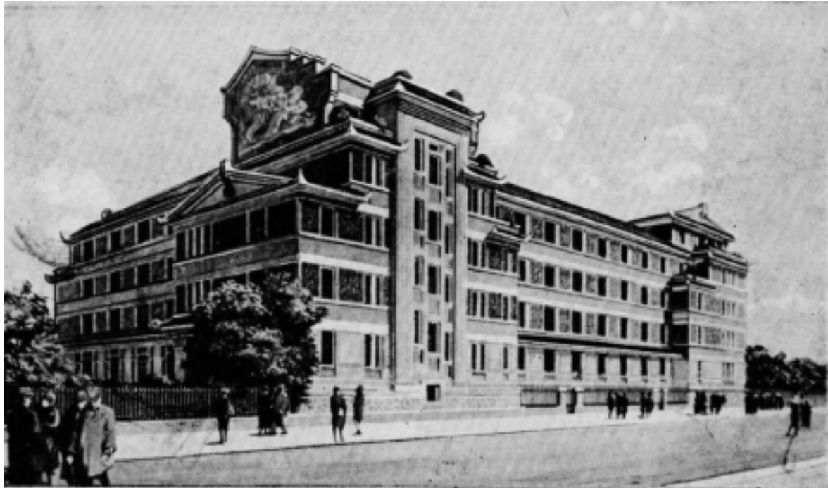
La maison des étudiants de l'Indochine (Comité de la maison des étudiants de l'Indochine, La maison des étudiants de l'Indochine , Paris, 1928)

Société pour l'amélioration morale, intellectuelle et physique des indigènes de la Cochinchine ( SAMIPIC ) ( L'Écho annamite , 11 octobre 1927)