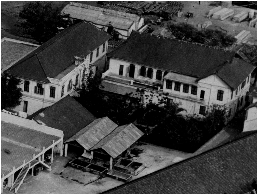
Détail : la maison du directeur. À l'arrière-plan, l'entrepôt de la Standard Oil of New-York.