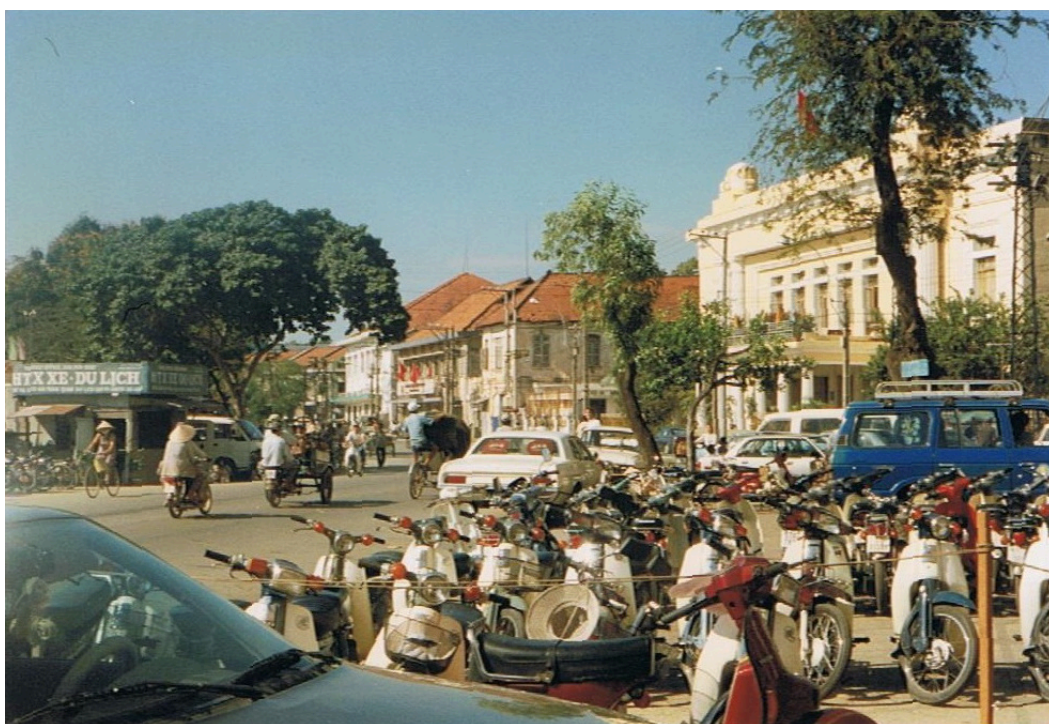
Saigon, Chuong Duong (quai de Belgique)(1994) : au second plan, à droite, l'ancien siège des Ets Ogliastro. Un peu plus loin vers la gauche, l'ancienne maison du directeur (drapeaux rouges).