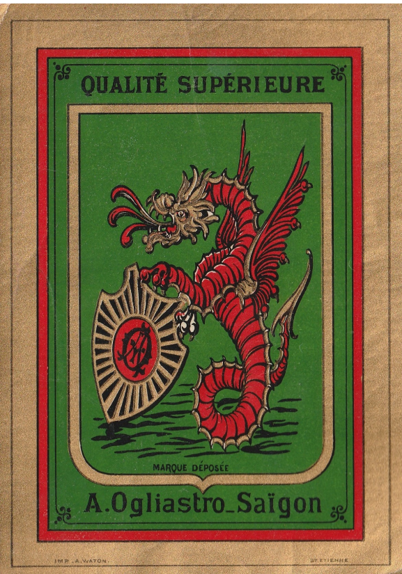
Imprimerie A. Waton, Saint-Étienne