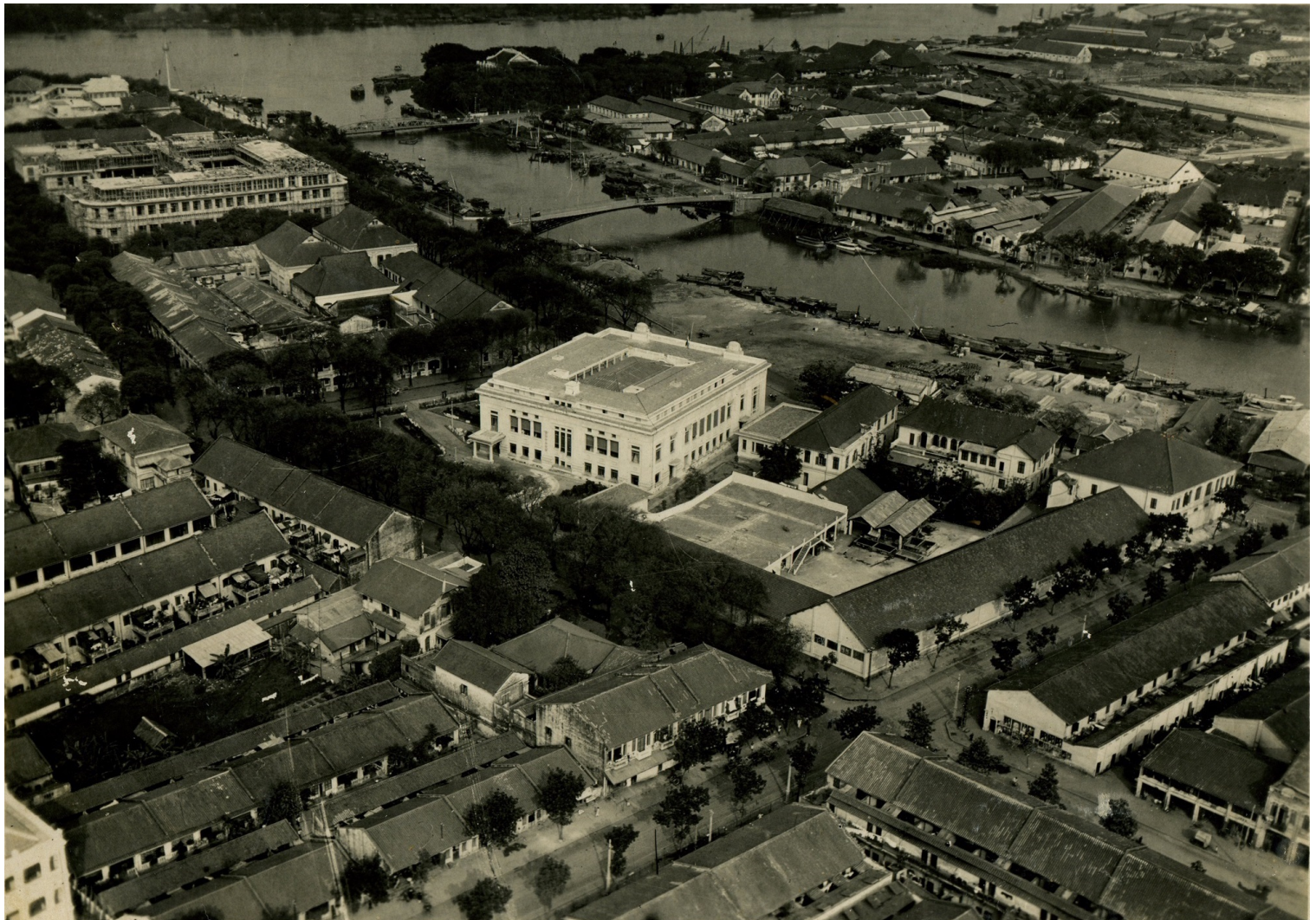
Le siège d'Ogliastro à Saïgon, quai de Belgique, au bord de l'arroyo Chinois, vers 1929. En haut à gauche, le siège de la Banque de l'Indochine encore dépourvu de toit.