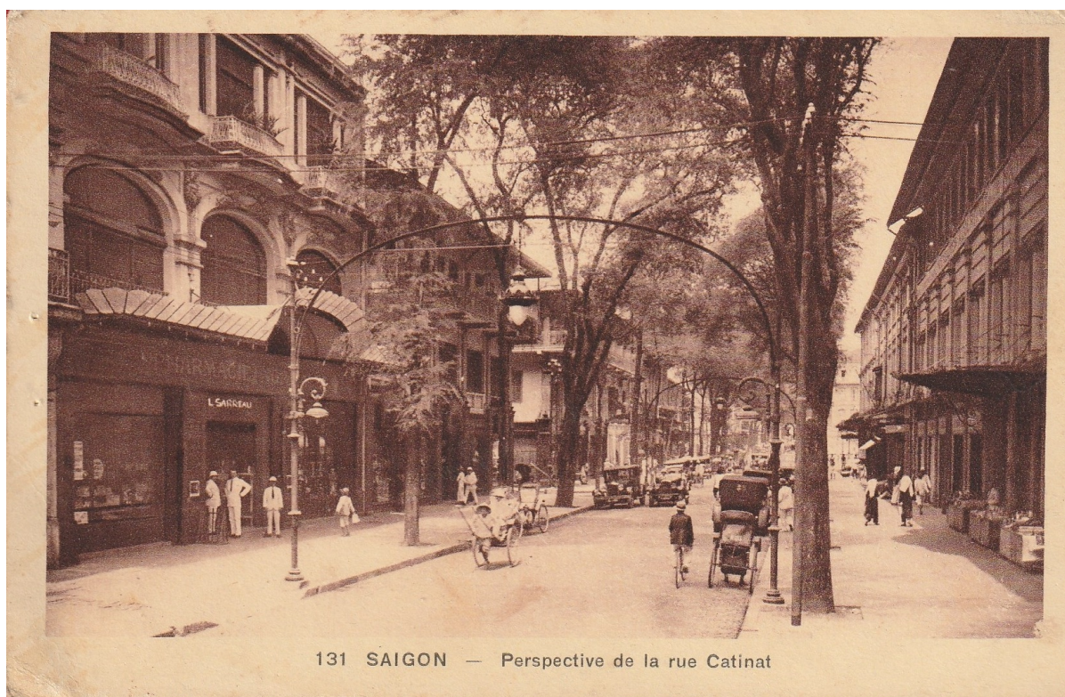
131 SAIGON — Perspective de la rue Catinat