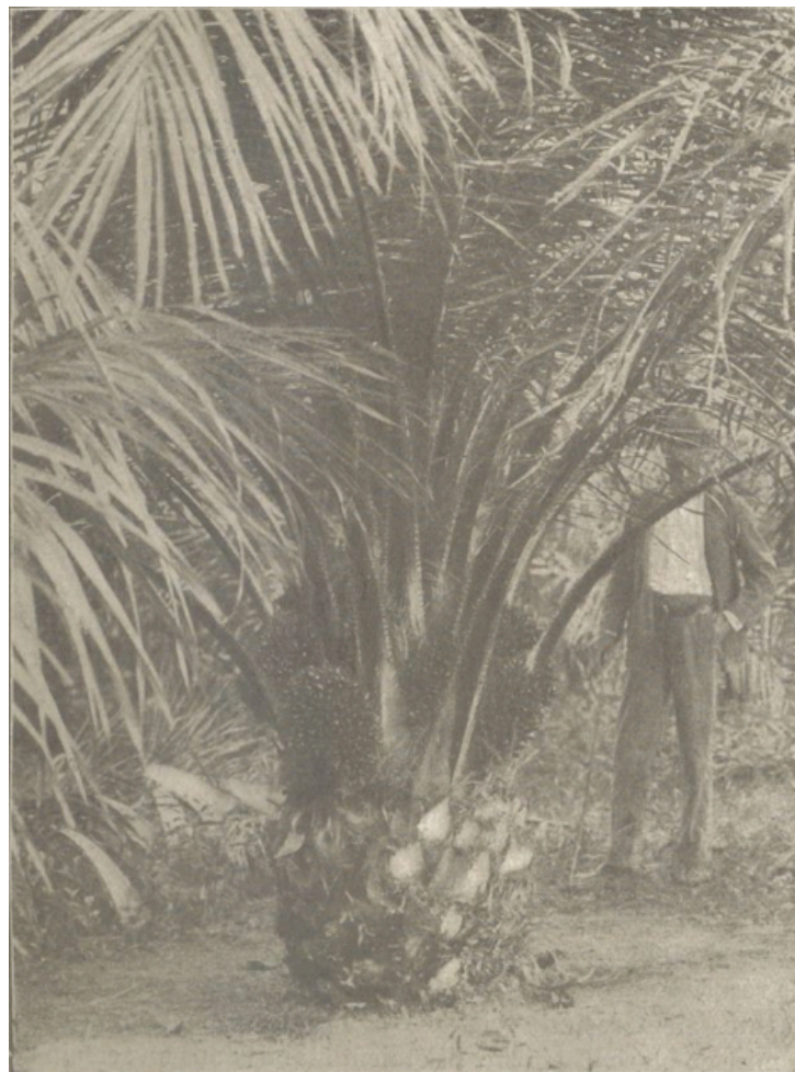
Palmier à huile de 4 ans en Malaisie britannique

3° La précocité de l'arbre est extraordinaire, puisque beaucoup de sujets portent à 3 ans des fruits utilisables et sont en plein rendement à la cinquième année. Ce dernier fait, qui n'était pas complètement établi faute de pouvoir contrôler l'âge des arbres, s'est trouvé confirmé dans la suite par mes essais de culture dans la presqu'île de Malacca.