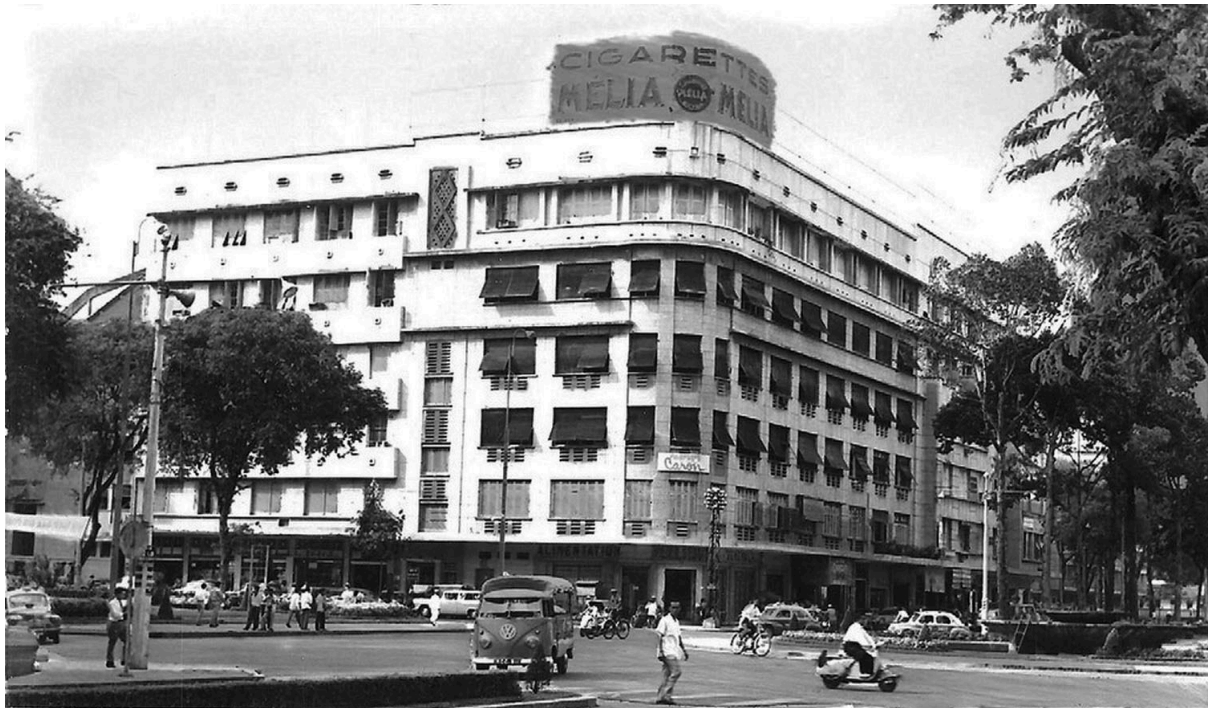
SAIGON * Hãng Liền-Seng THE STORES-HOUSES LIEN-SENG - LES MAGASINS LIEN-SENG