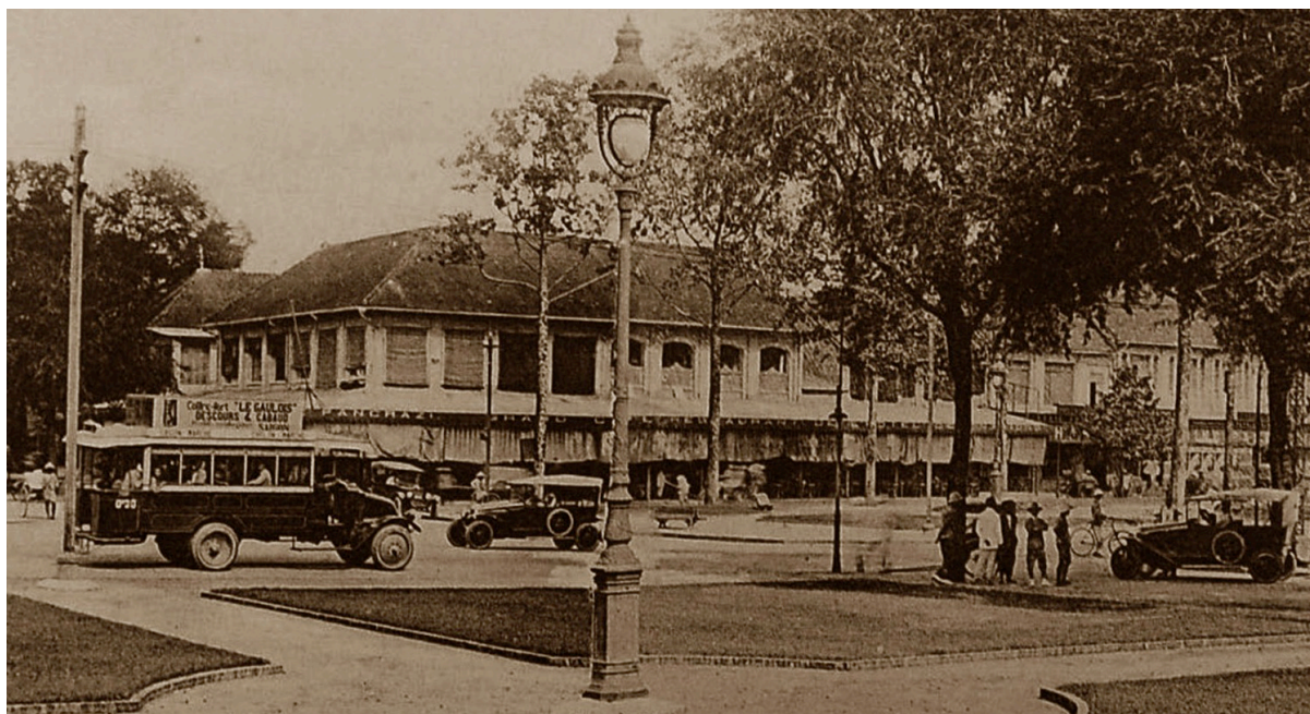
PANCRAZI - GRAND CAFÉ-RESTAURANT DE L'HÔTEL DES NATIONS