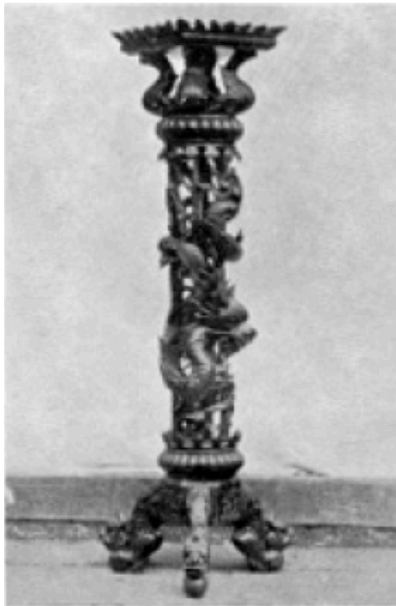
Planche XLI Trépied. Bois sculpté à Son-Tay. 1930

TROIS ATTITUDES DU DRAGON DANS L'ART ANNAMITE Y. LAUBIE des Missions étrangères de Paris ( Bulletin des Amis du vieux Hué , 28 e année, n° 2, avril-juin 1941)