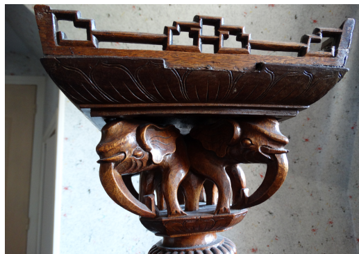
Vendue en 2015 à Normanville (Eure)(Le Bon Coin)