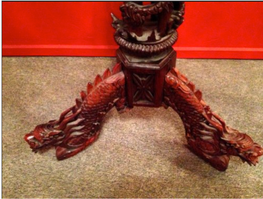
Vendue par Le Soleil rouge, Villeurbanne (2013)