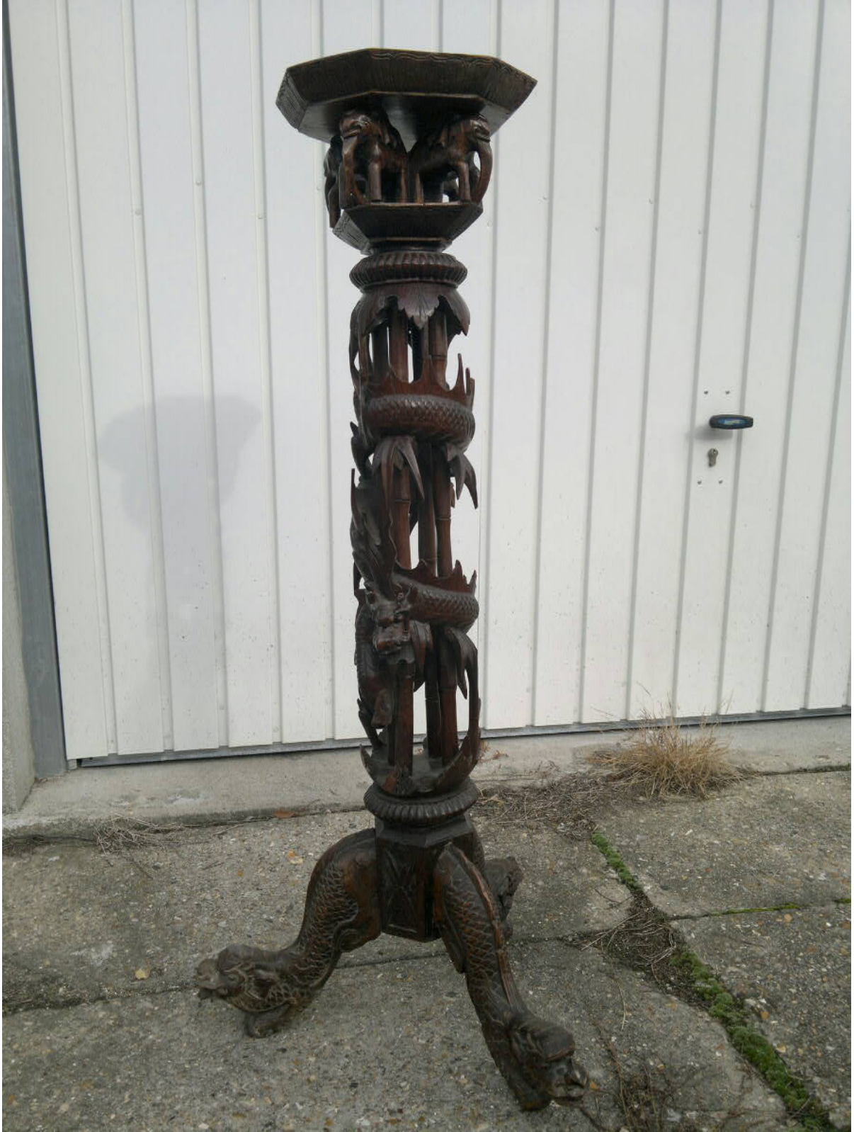
Banlieue parisienne