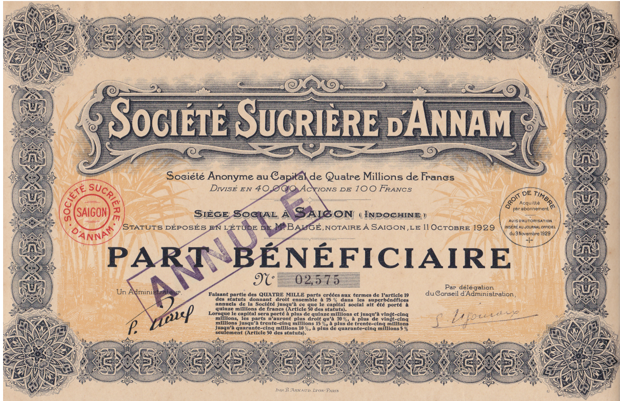
Coll. Olivier Galand www.entreprises-coloniales.fr/empire/Coll._Olivier_Galand.pdf PART BÉNÉFICIAIRE ANNULÉE