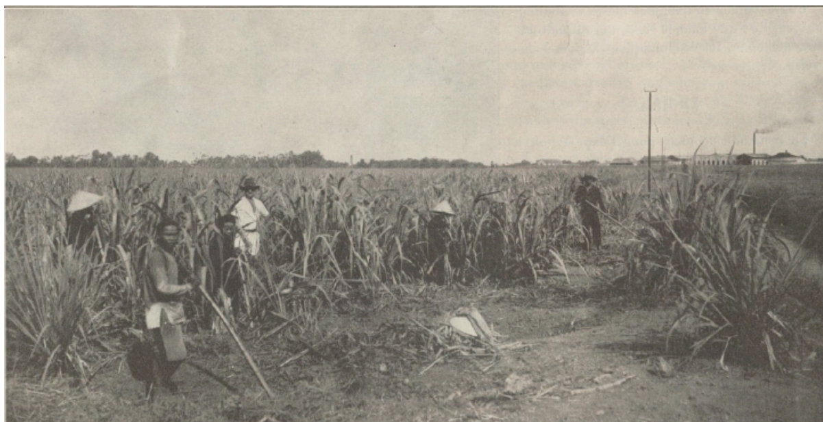
Plantation de canne à sucre

Est-ce l'usine de la Sucrière d'Annam qu'on aperçoit au fond à droite ? ( Bulletin de l'Agence économique de l'Indochine , août 1934, p. 299)