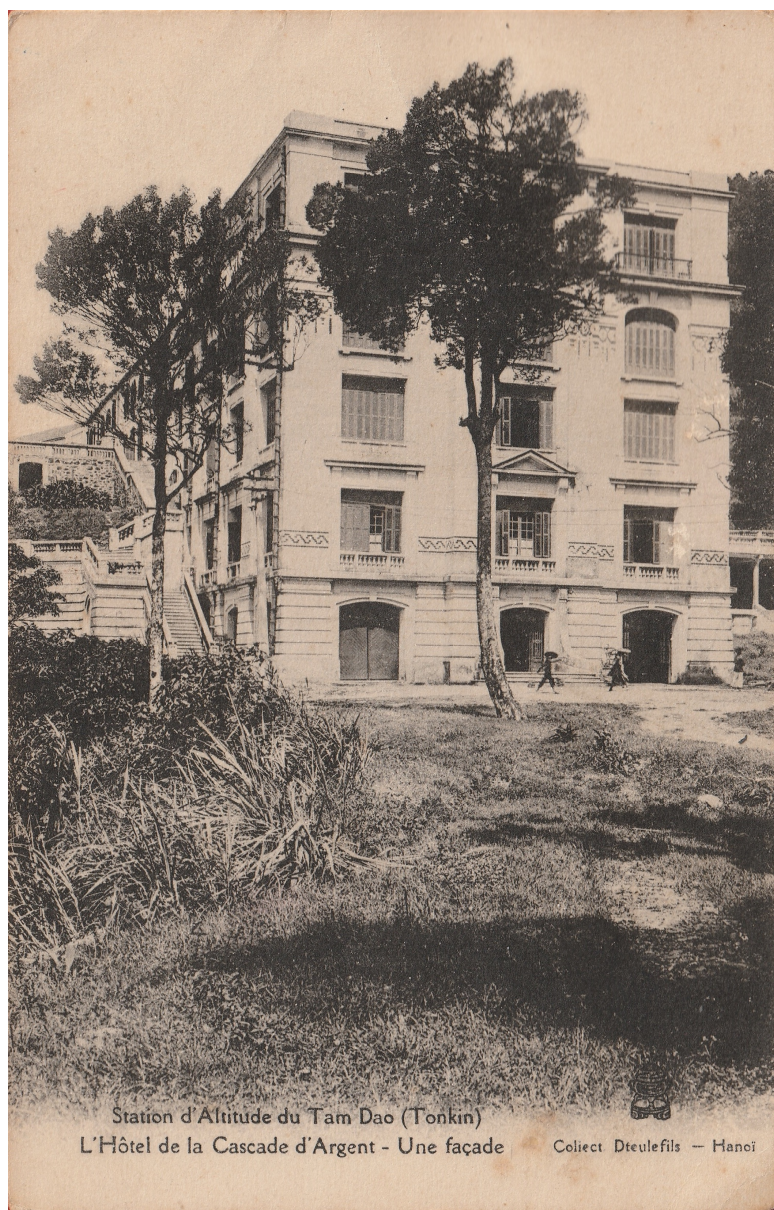
Station d'Altitude du Tam Dao (Tonkin) L'Hôtel de la Cascade d'Argent - Une façade