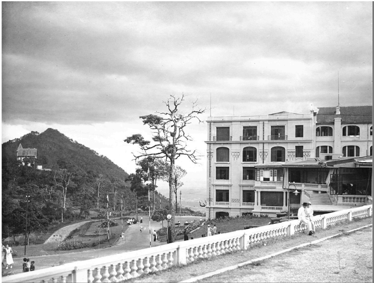
L'Hôtel de la Cascade d'argent