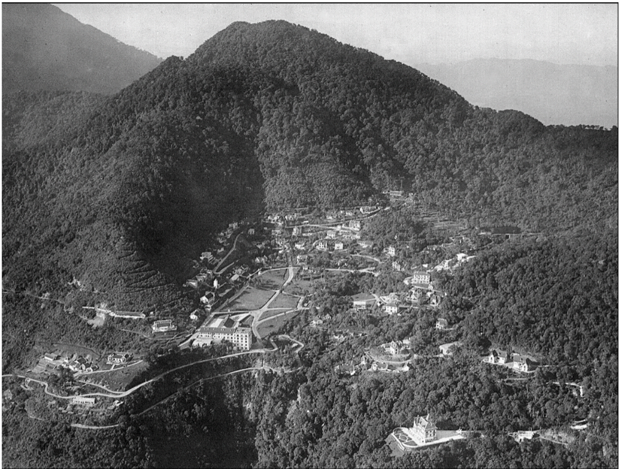
Tamdao : vue aérienne