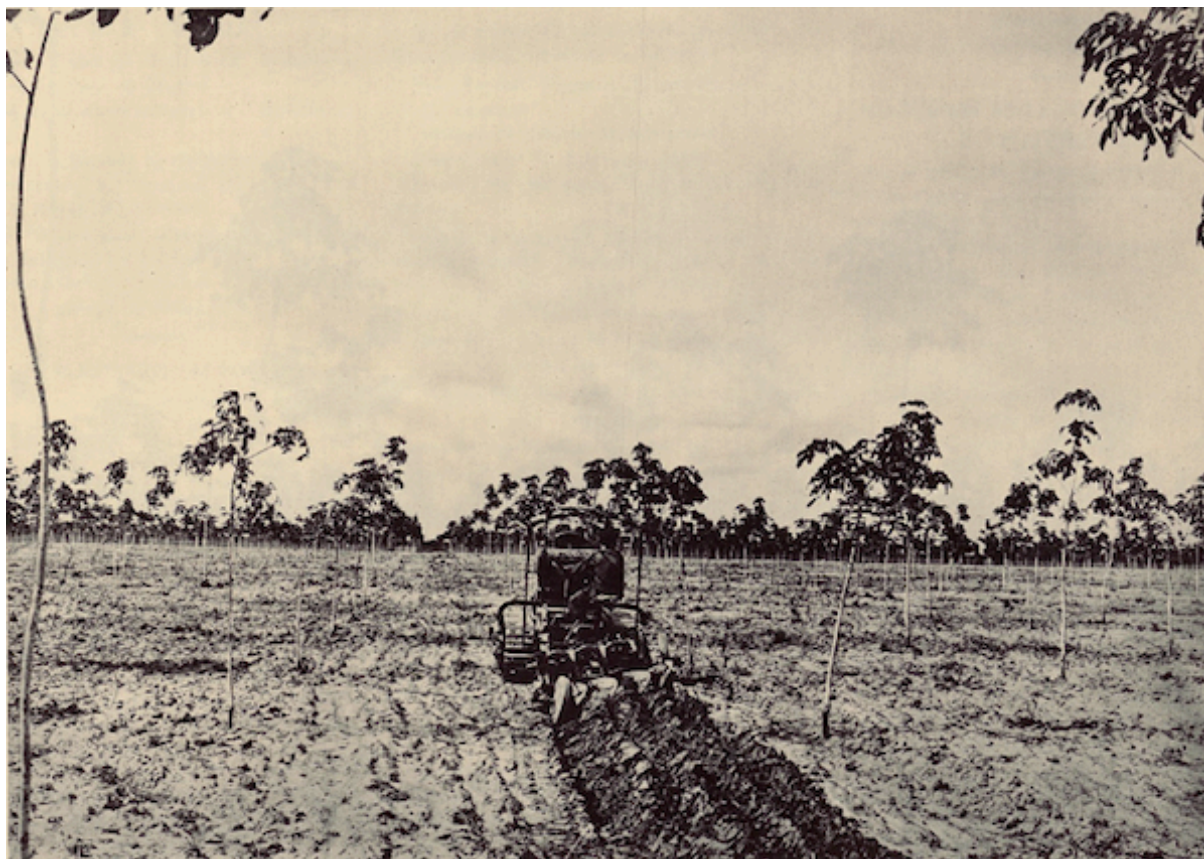
Planche 43. — Labour mécanique