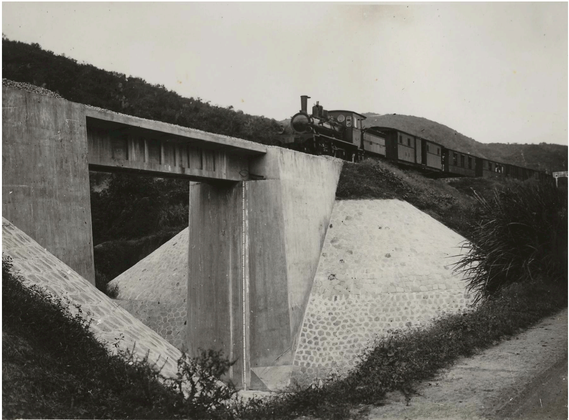
PONT EN BÉTON ARMÉ DE 12,00 P. K. 167+490