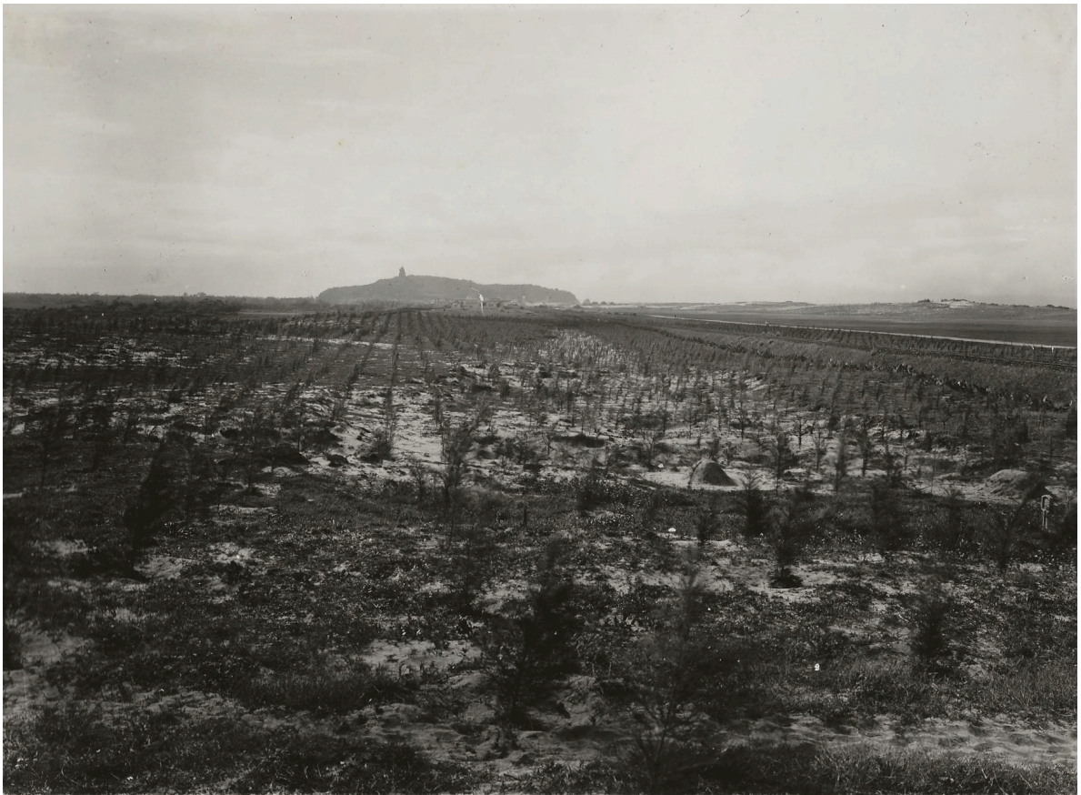
PLANTATIONS DE FILAOS VILLAGE MINH CHINHP. K. 121+140 DU CH. DE FER