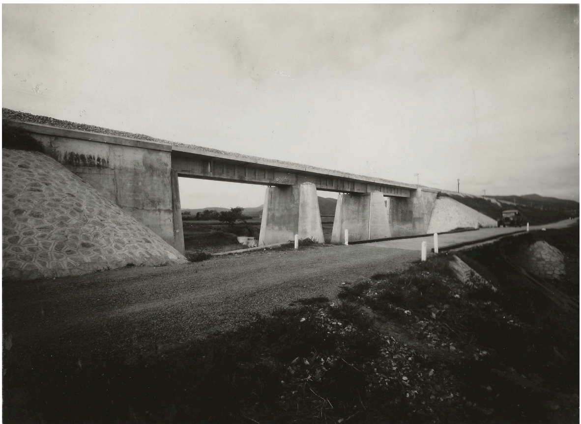
PONT EN BÉTON ARMÉ DE 3 x 12 m 00 P. K. 147+748