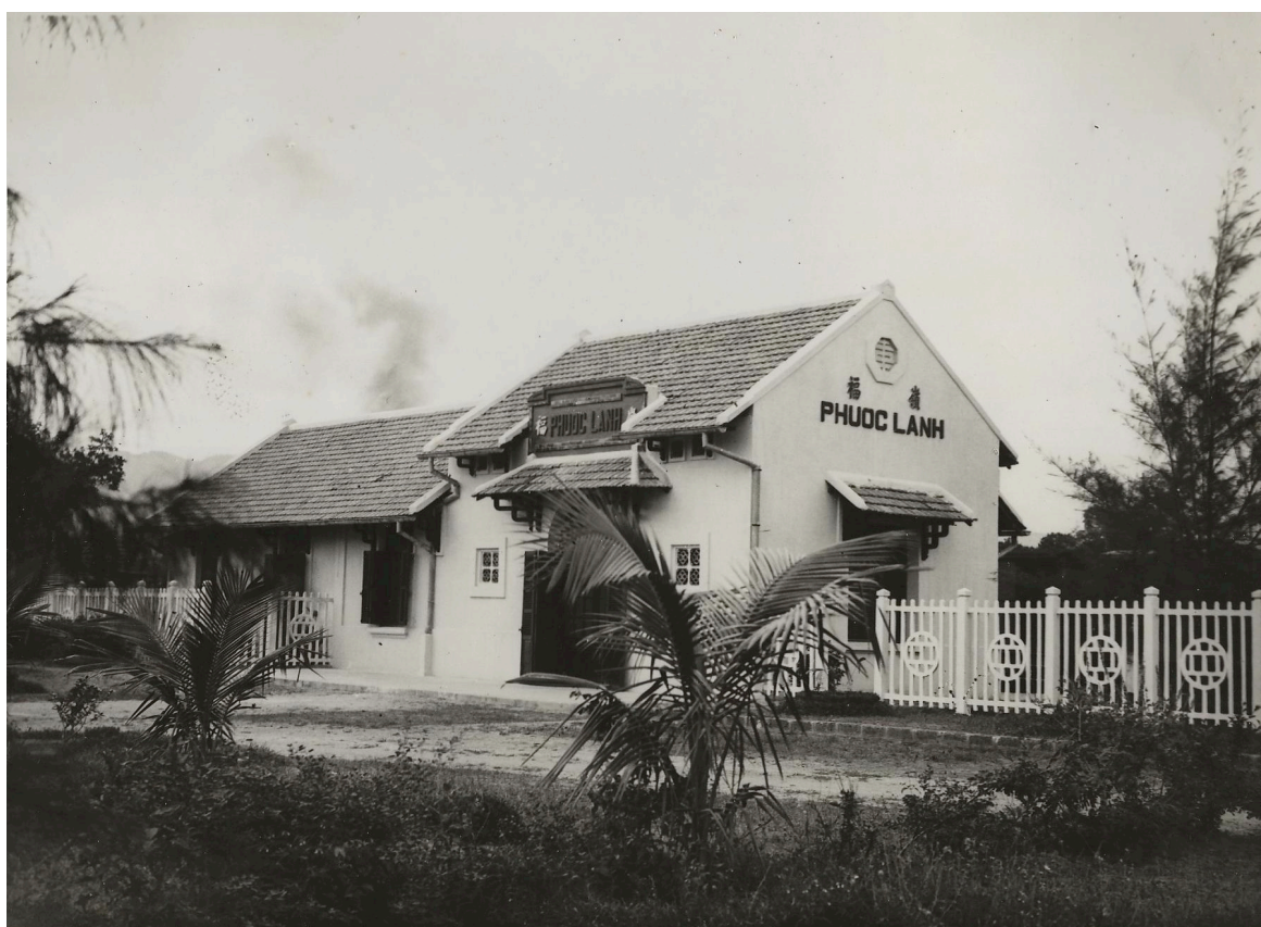
GARE DE PHUOC-LANH P. K. 174+629 64