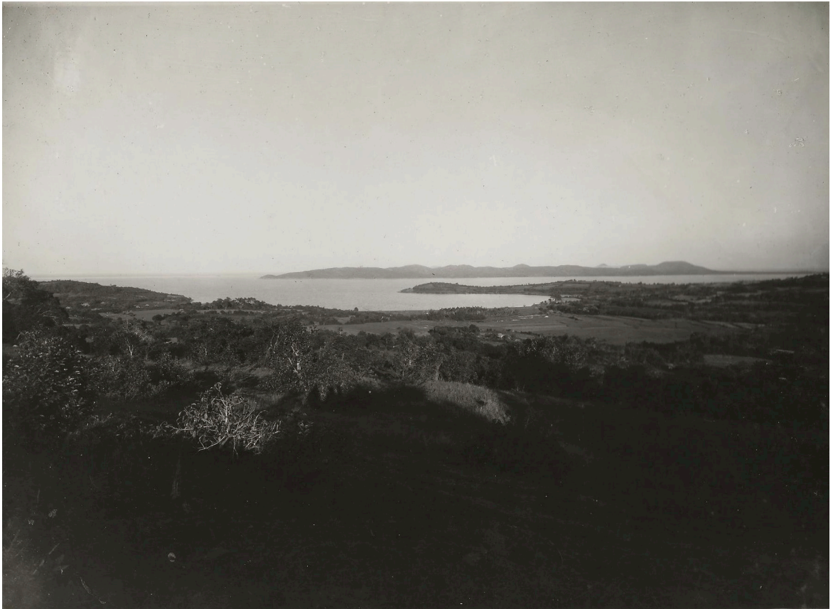
VUE PANORAMIQUE DE LA RÉGION DE CHO-GANH P. K. 139+350 DU CH. DE FER