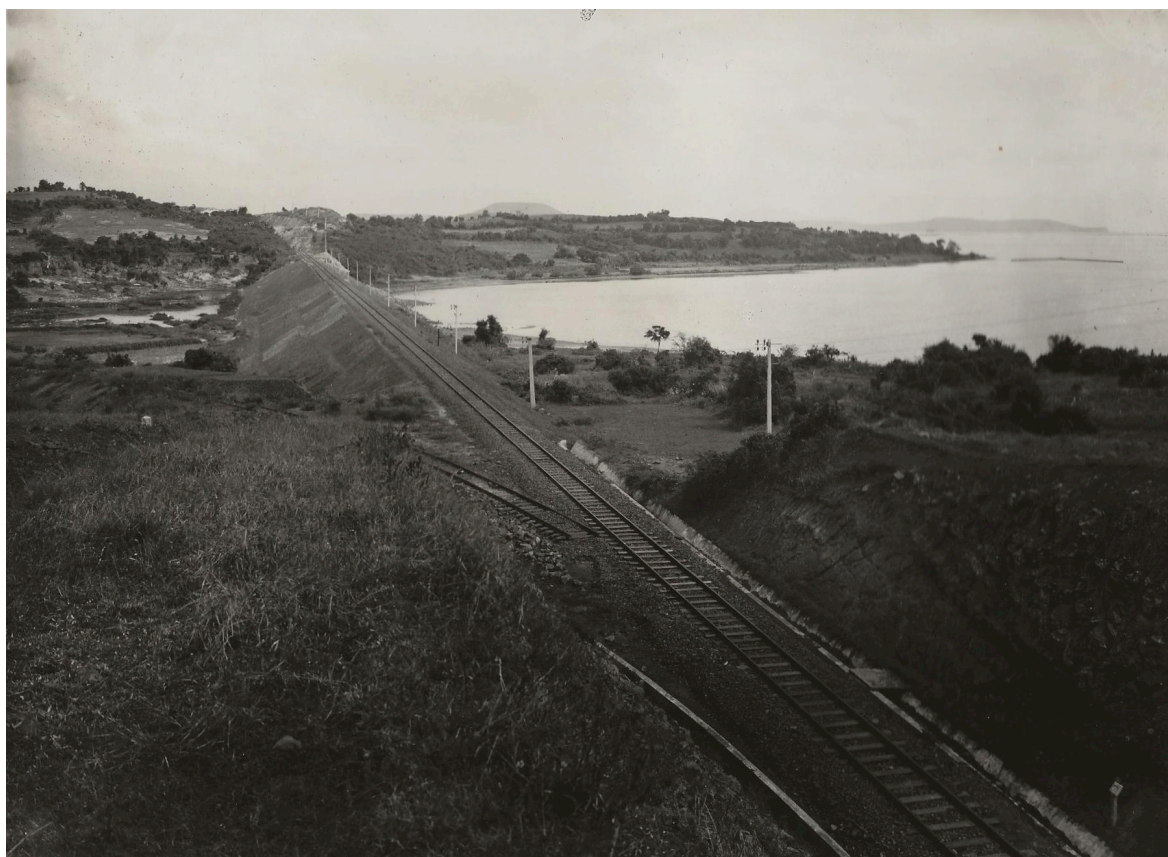
HAUT REMBLAI P. K. 136+500 (O LANG-DAM)