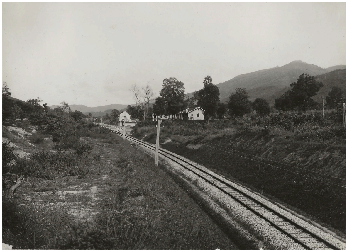
GARE DE MUC-THINH p. k. 180+592 VUE DU PONT DU P. K. 180+400