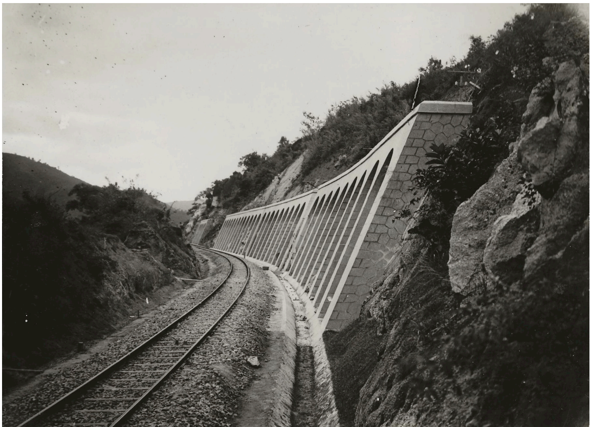
MURS DE SOUTÈNEMENT À LA MONTAGNE D'OR P. K. 166+420 —VUE DU CÔTÉ NORD