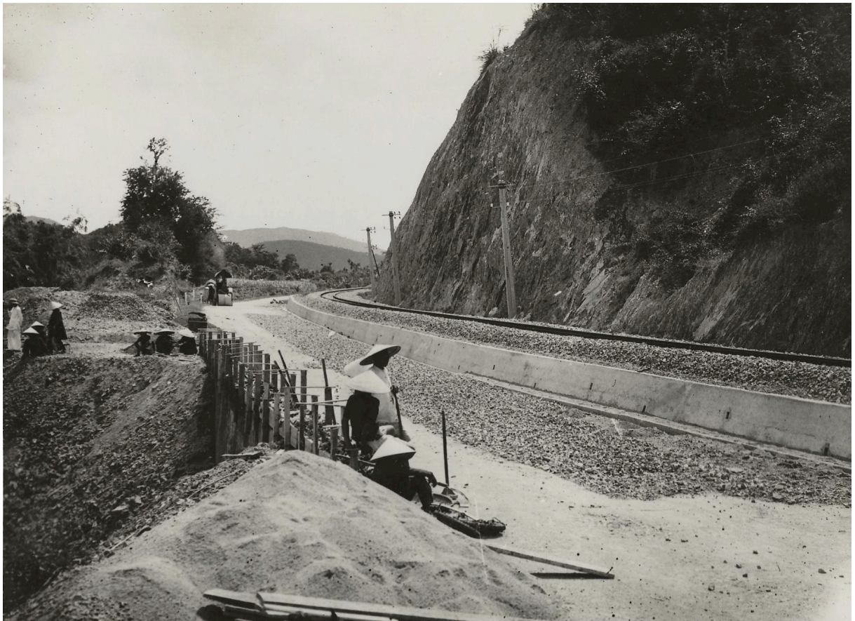
COLLINE DU POISSON p. k. 155+200 VUE DU CÔTÉ SUD