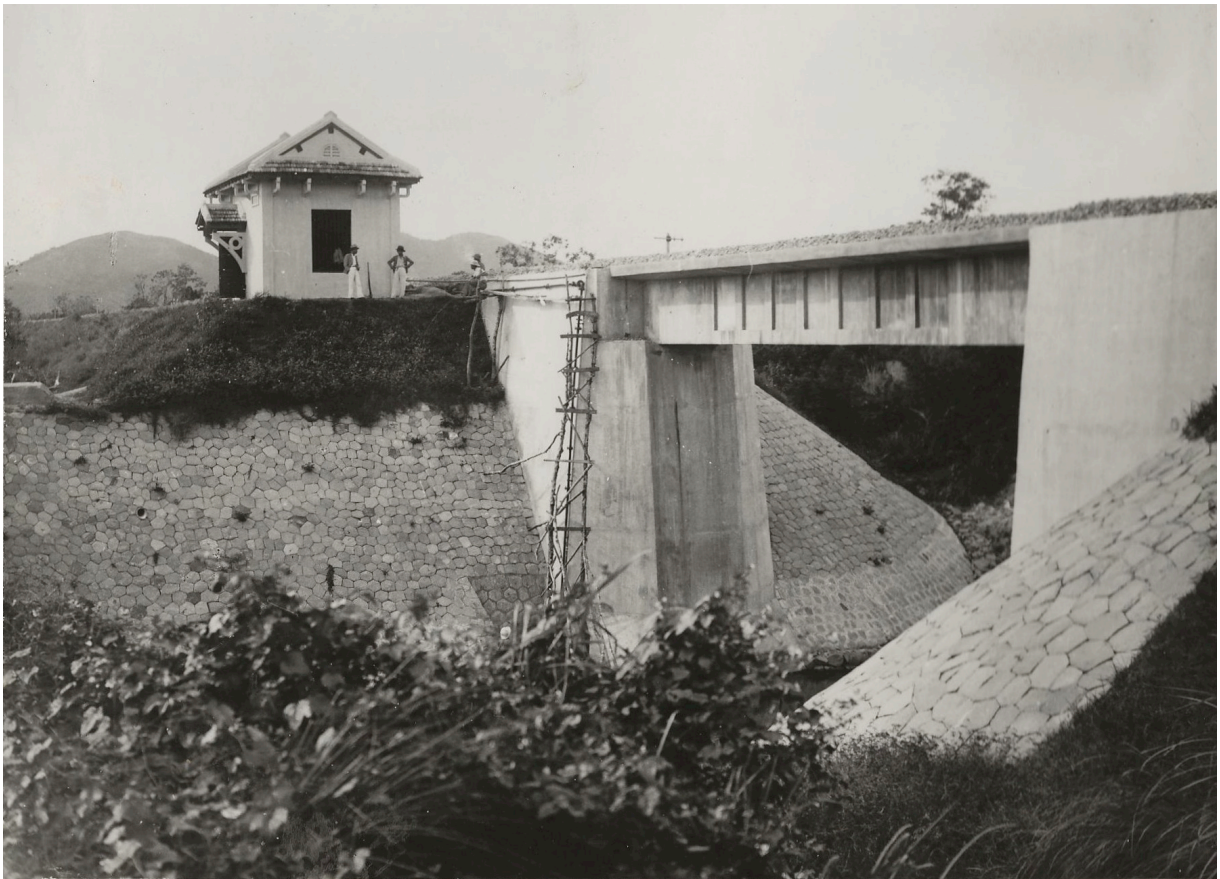
CABINE DE POMPAGE DE VAN-CANH VUE DU PONT DU P. K. 191+246