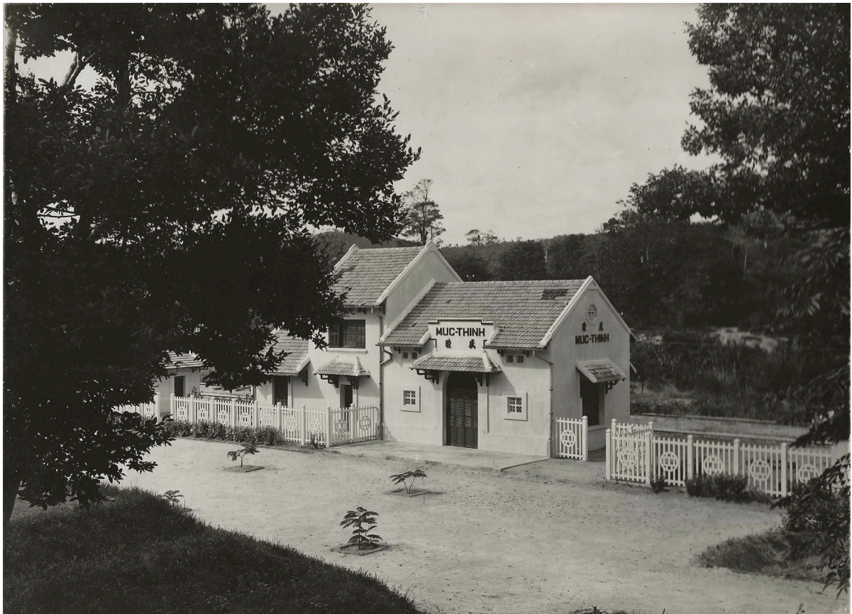
GARE DE MUC-THINH p. k. 2 x 10,00 BÂTIMENTS À VOYAGEURS