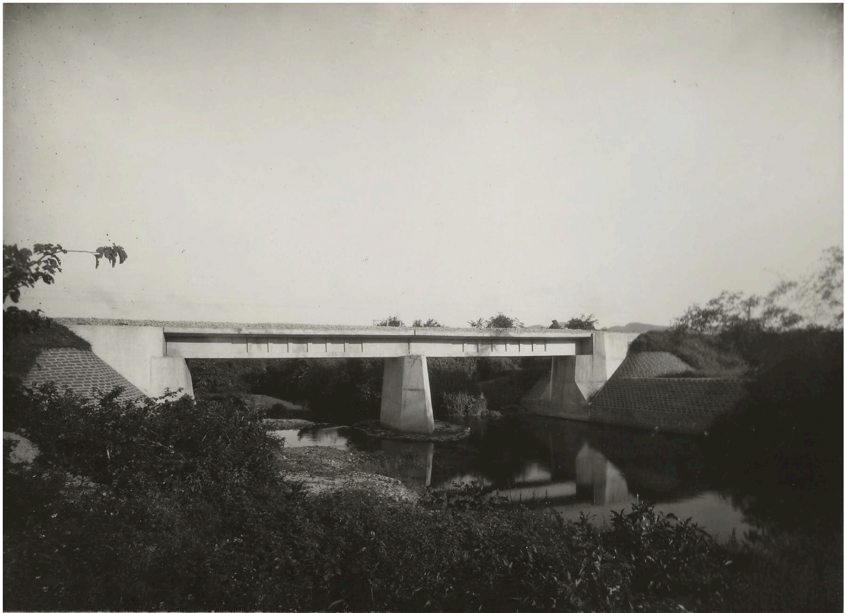
PONT EN BÉTON ARMÉ de 2 x 10,00 P. K. 206+012