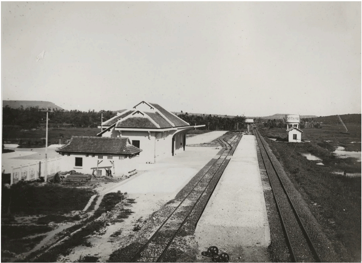
GARE DE CHI-THANH BÂTIMENTS À VOYAGEURS