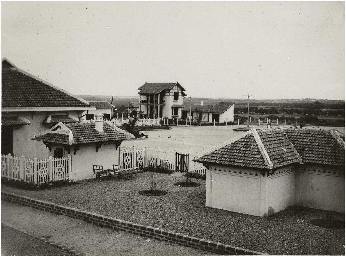
GARE DE TUY-HOA VUE DU CÔTÉ DE LA VOIE