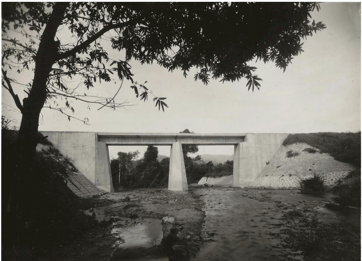
PONT EN BÉTON ARMÉ DE 2 x 10,00 P. K. 190+278 91