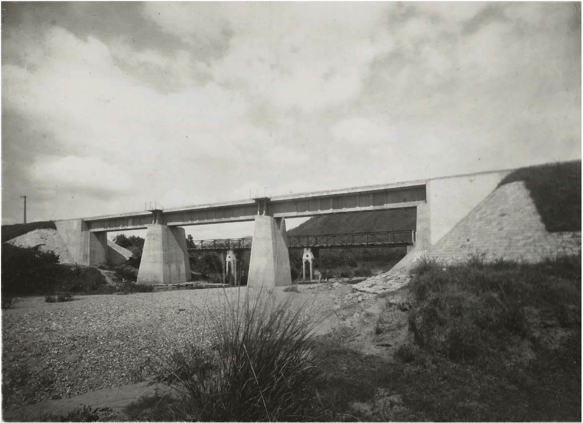
PONT EN BÉTON ARMÉ DE 3 T x 15 m 00 P. K. 173+553 64