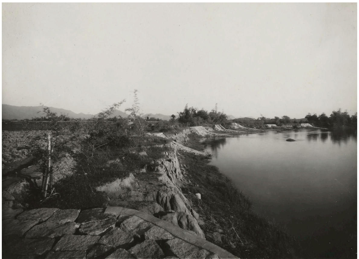
HALTE DE ATRACH P. K. 214+529