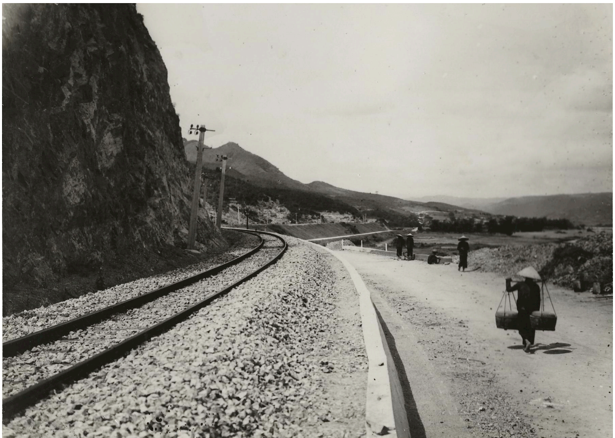
COLLINE DU POISSON p. k. 155+200 VUE DU CÔTÉ NORD