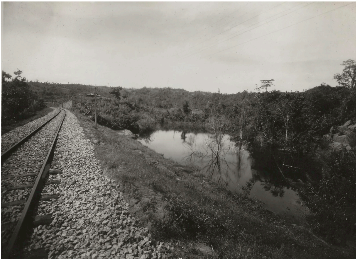
LAC ARTIFICIEL DU P. K. 178+420