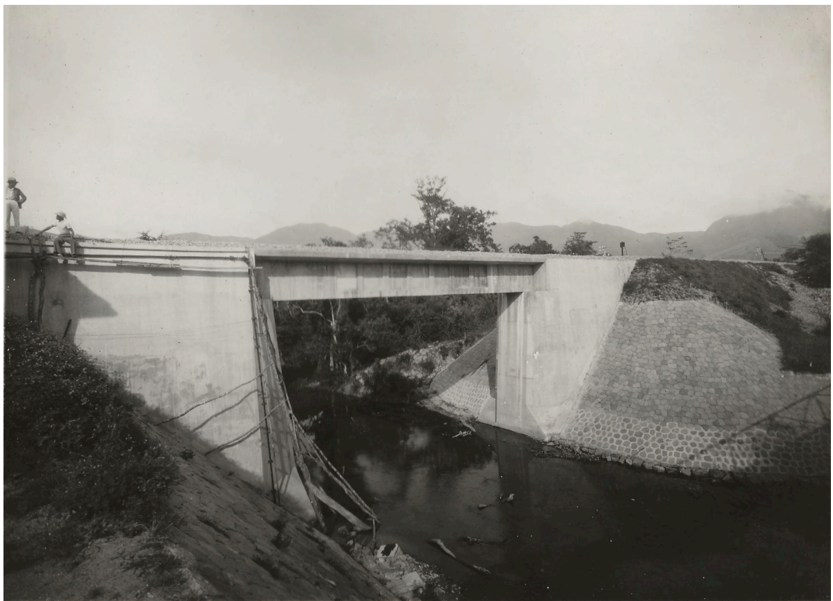
PONT EN BÉTON ARMÉ 15,00 P. K. 191+246