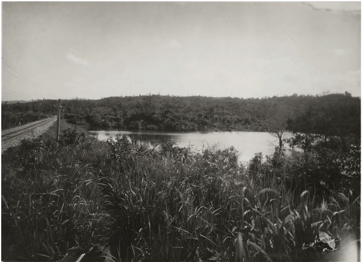
LAC ARTIFICIEL DU P. K. 178+420