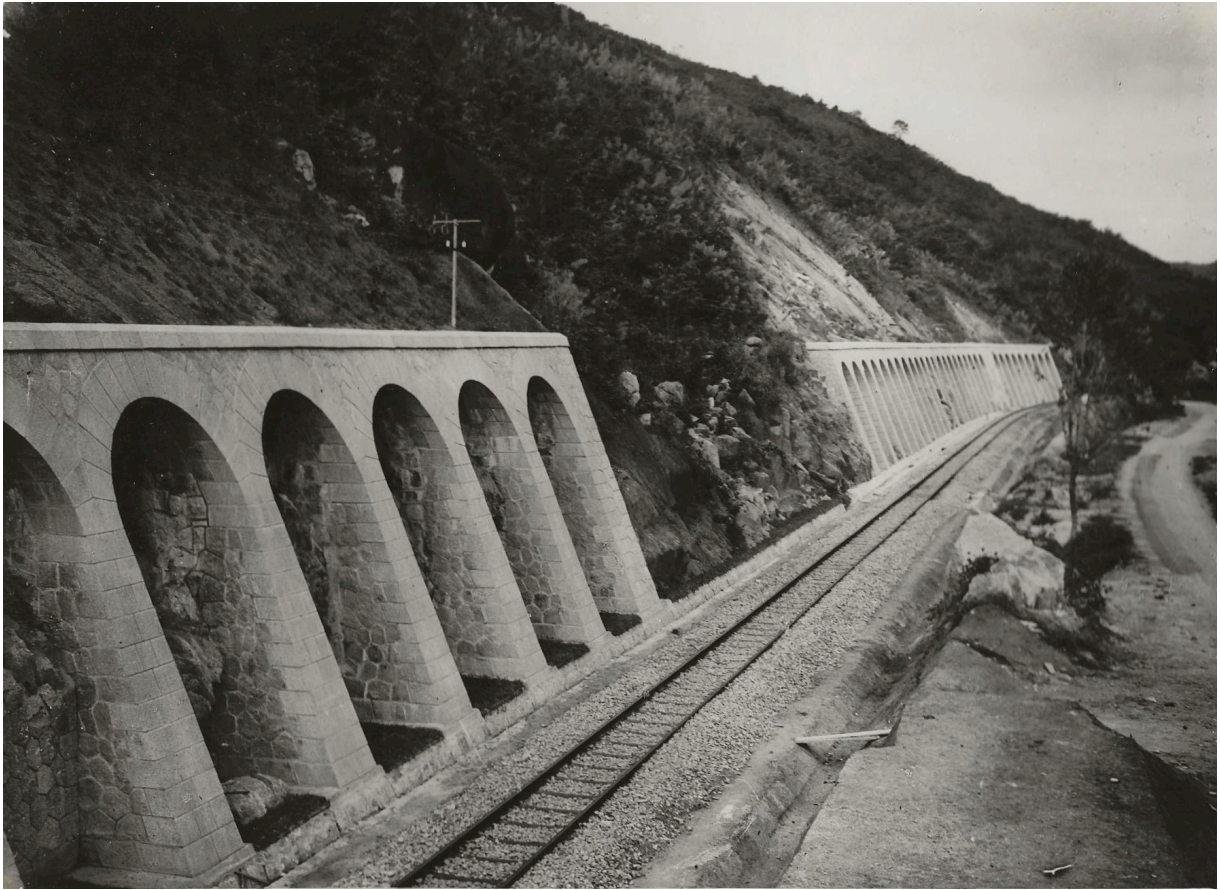
MURS DE SOUTÈNEMENT À LA MONTAGNE D'OR P. K. 166+420 —VUE DU CÔTÉ SUD