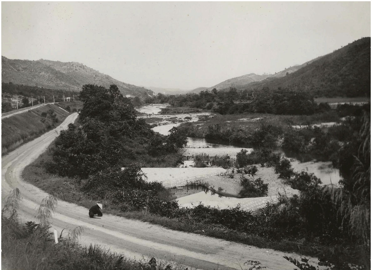
ÉPIS DE TRÀ-Ô P. K. 167+260