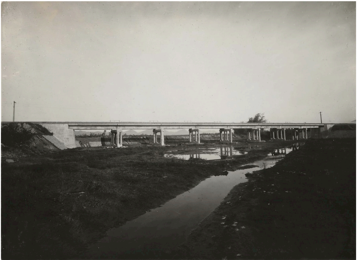
PONT EN BÉTON ARMÉ DE 8 x 6,00 P.K.216+683