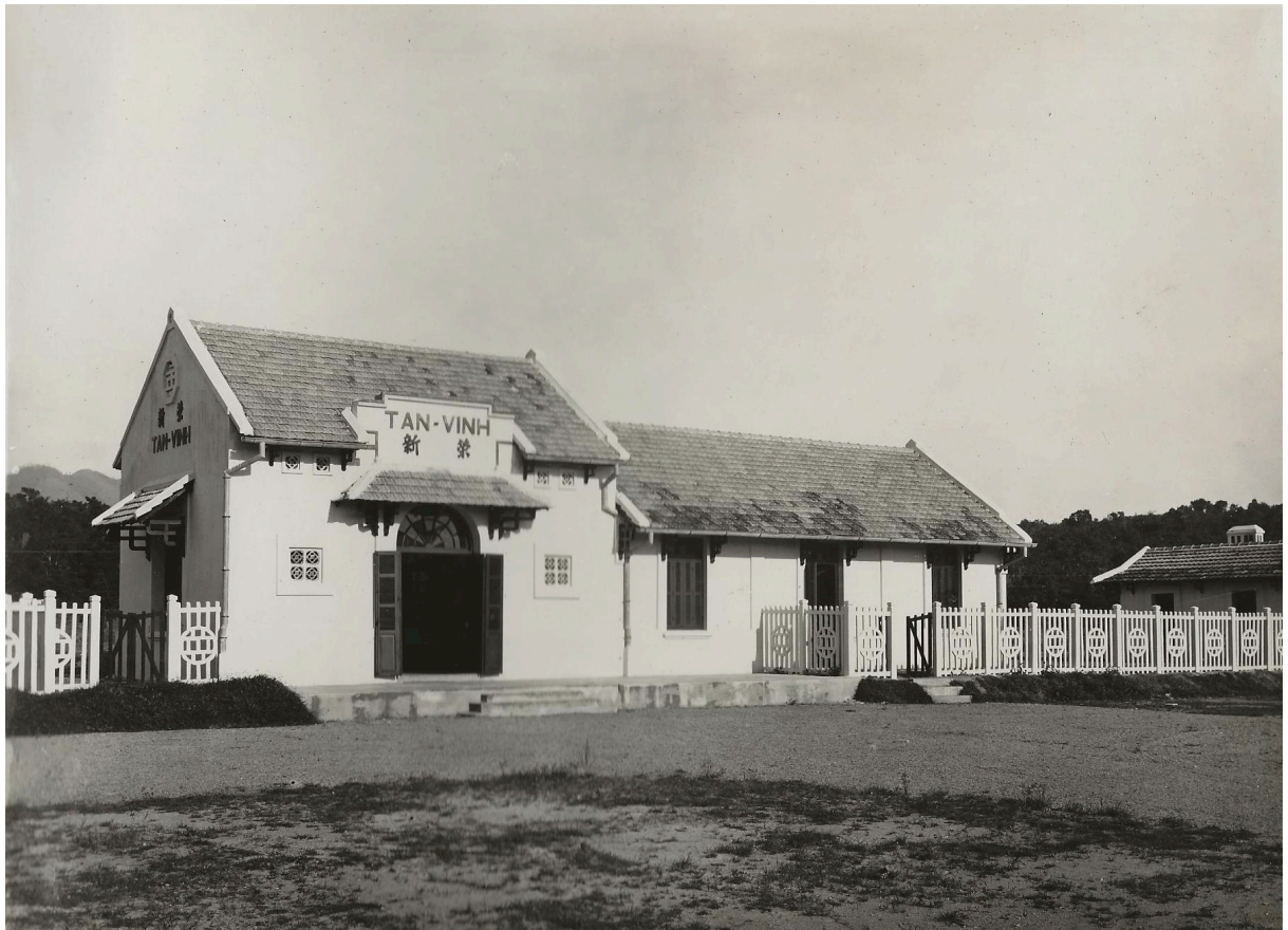
GARE DE TAN-VINH P. K. 203+196 BÂTIMENTS À VOYAGEURS