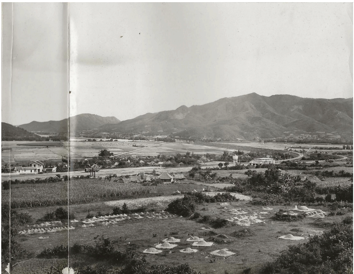
GARE DE LA-HAI VUE D'ENSEMBLE (DE GAUCHE À DROITE)