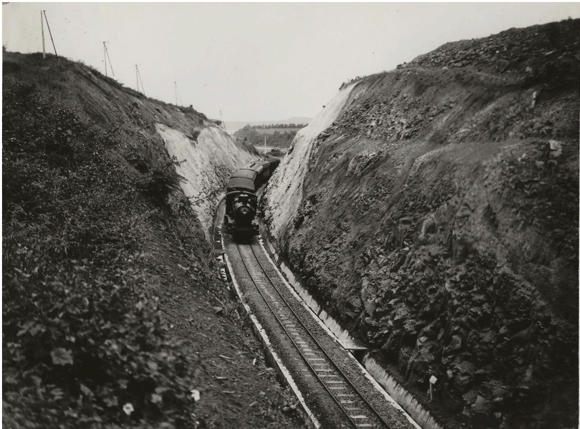
TRANCHÉE DU P. K. 136+800