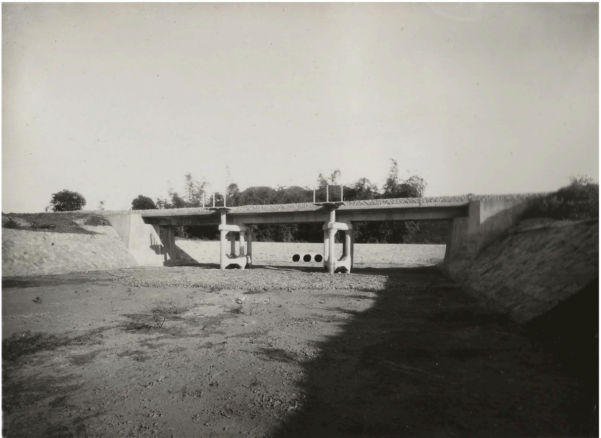
PONT EN BÉTON ARMÉ de 3 x 6,60 P. K. 215+028 VUE DU CÔTÉ AMONT DU PONT