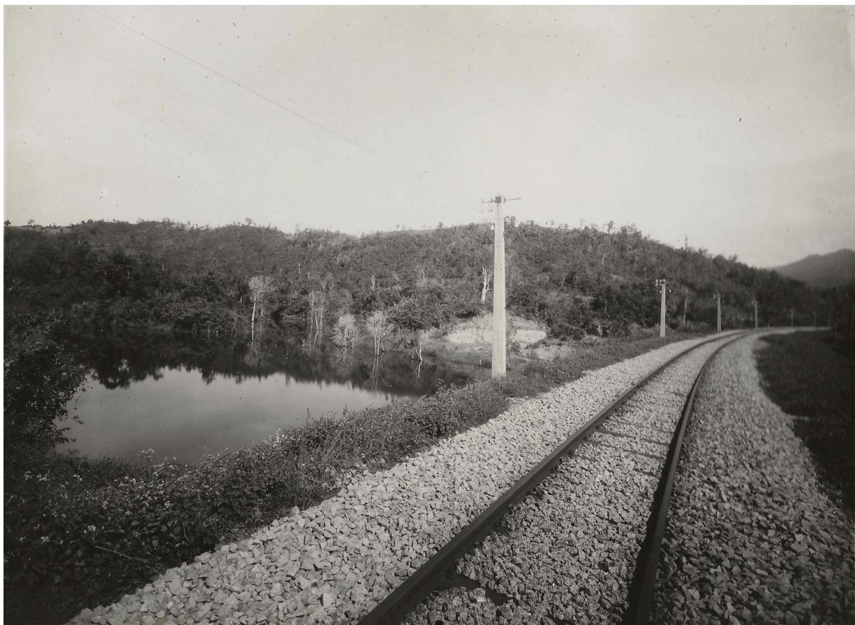
LAC ARTIFICIEL DU P. K. 177+200