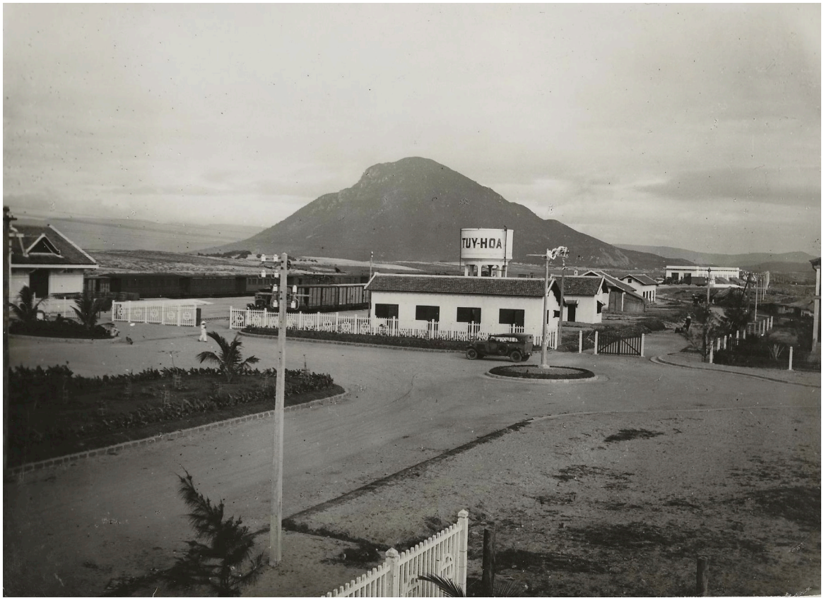
GARE DE TUY-HOA ACCÈS À LA COUR DE LA GARE