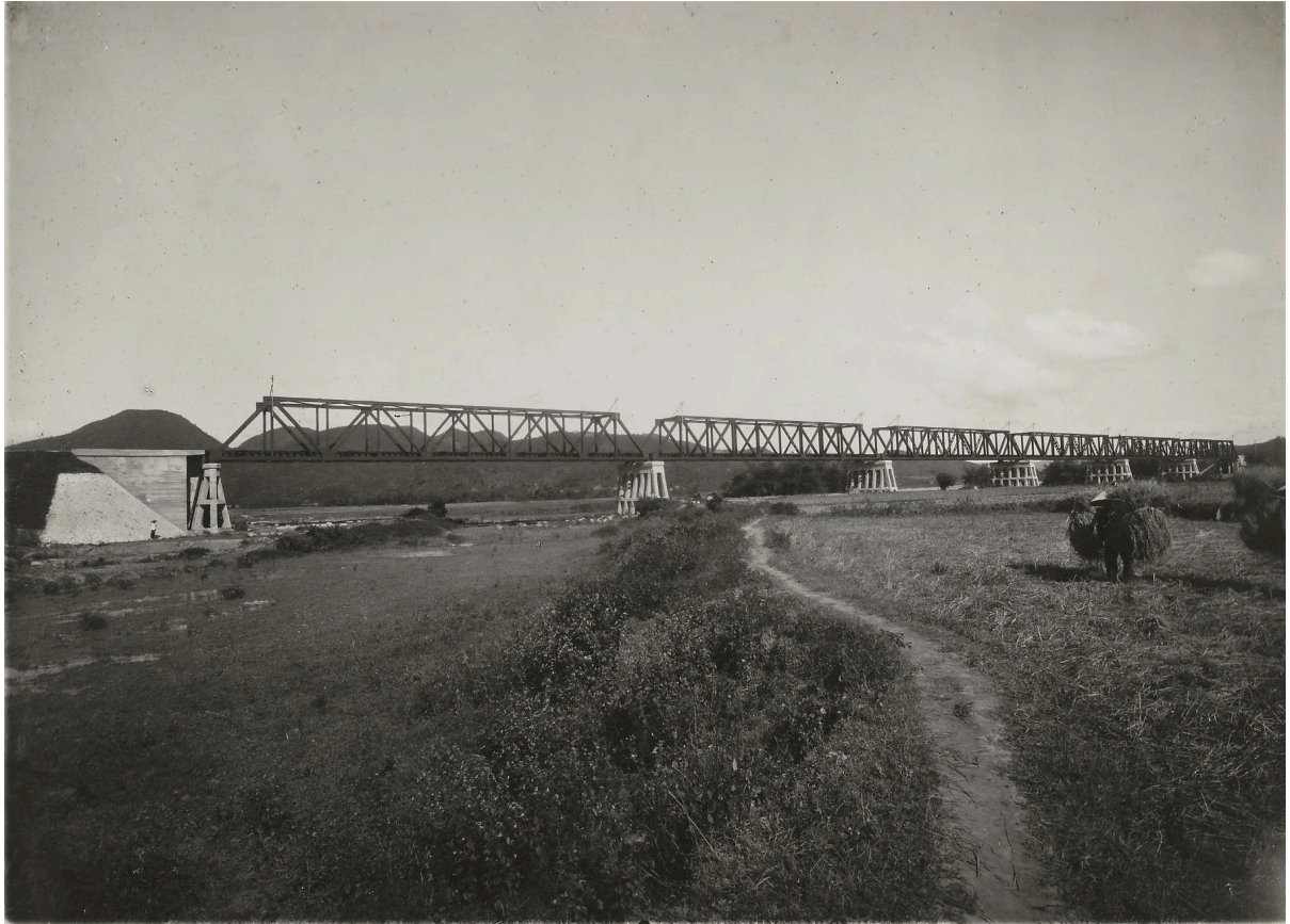
PONT MÉTALLIQUE À 6 T x 50,00 SUR LE SONG CAY DUA P. K. 158 x 258