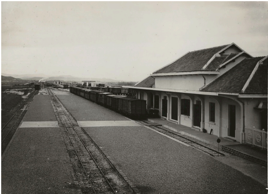
GARE DE TUY-HOA TROTTOIRS ET VOIES D'ÉVITEMENT