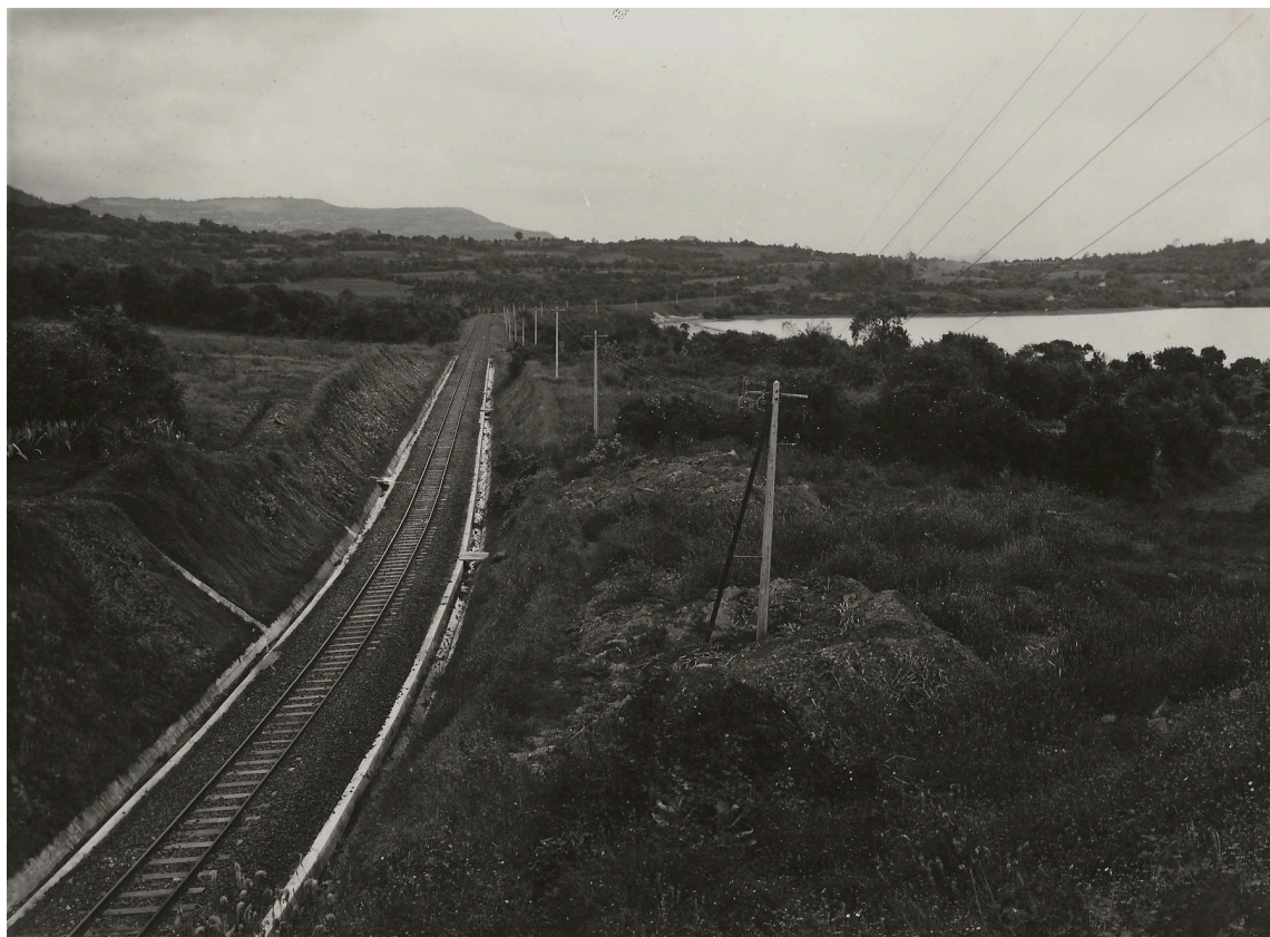
FOSSÉ MAÇONNÉ SORTIE DE LA TRANCHÉE DU P. K. 136+800