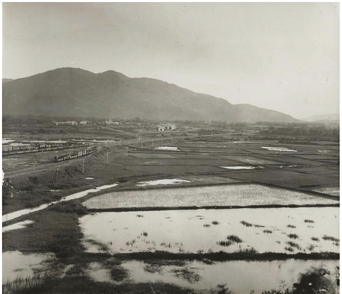
GARE DE DIÊU-TRÌ VUE D'ENSEMBLE (de gauche à droite)