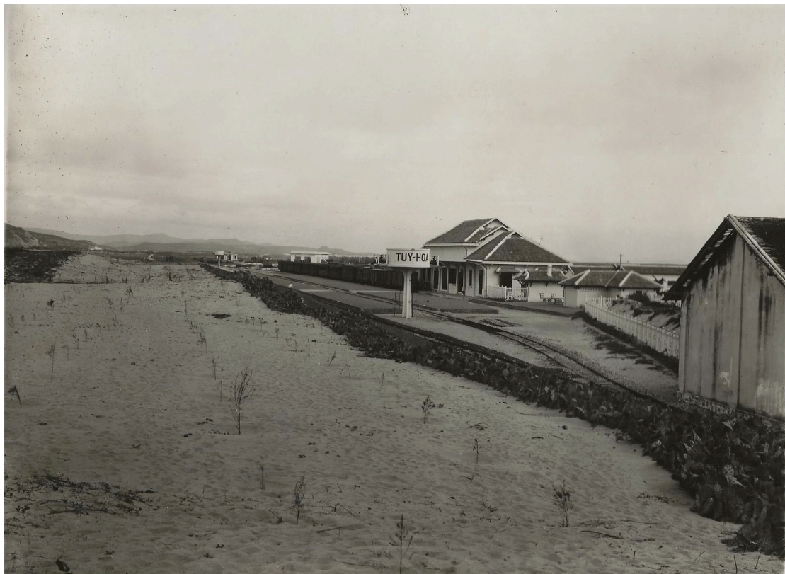
GARE DE TUY-HOA VUE DE LA FAÇADE LATÉRALE GAUCHE DU BÂTIMENT À VOYAGEURS