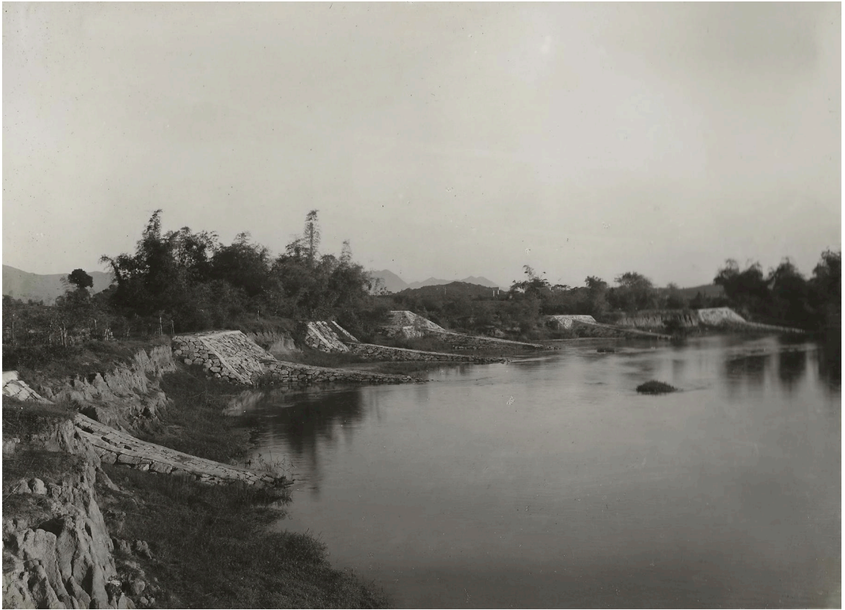
ÉPIS SUR SONG HÀ-THANH P. K. 2115+100