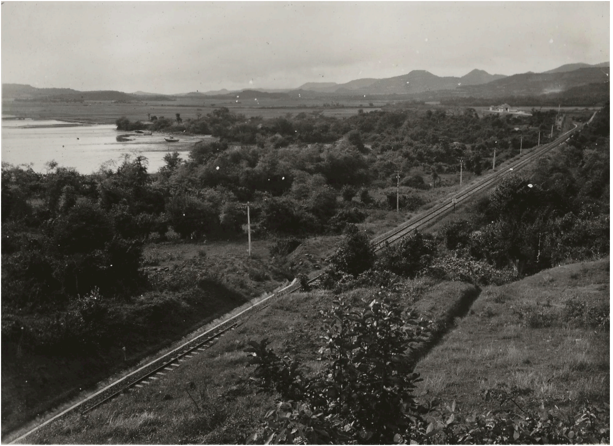
PANORAMA DE MY-PHU VUE DU P. K. 136+000