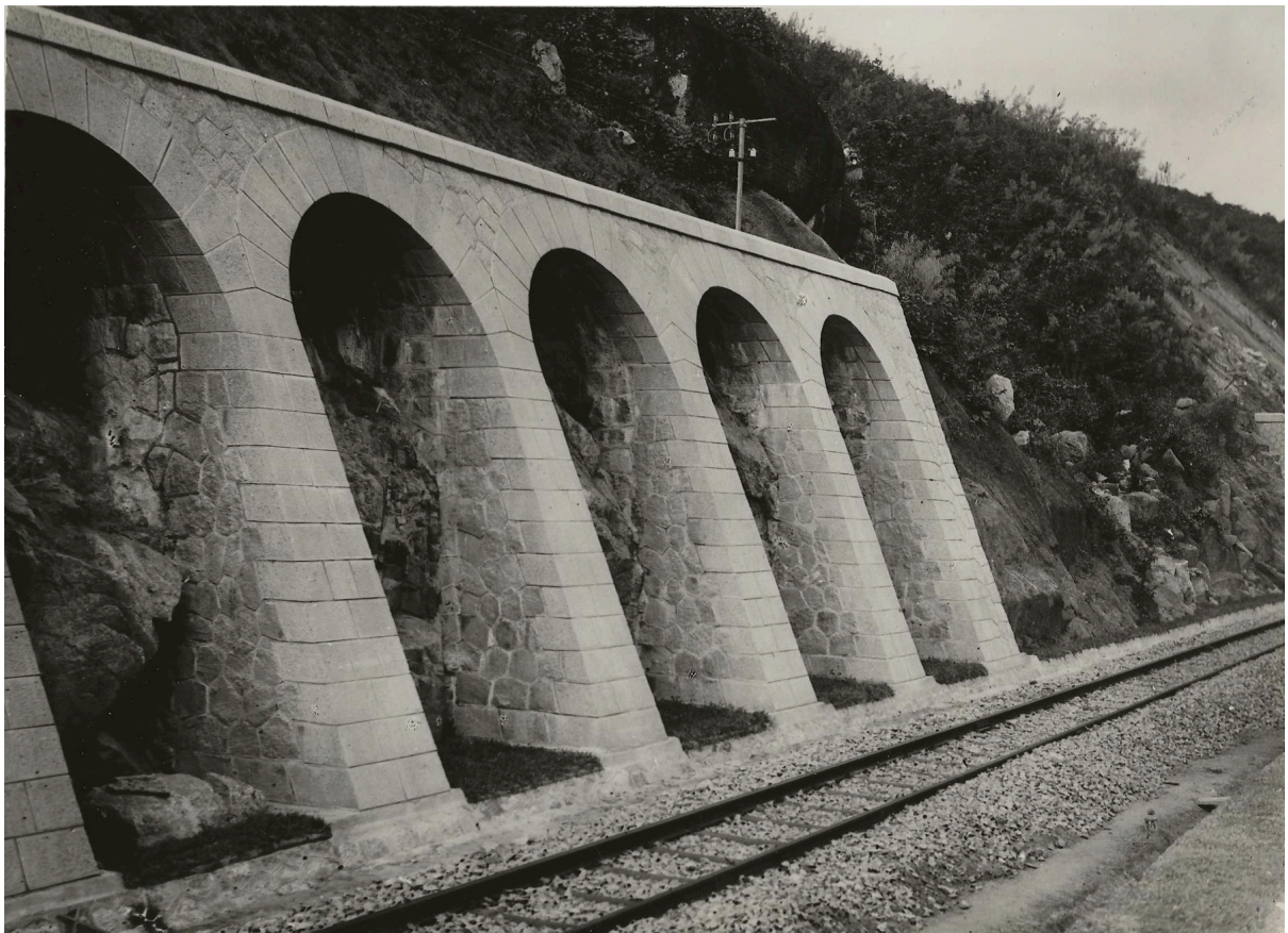
MURS DE SOUTÈNEMENT À LA MONTAGNE D'OR P. K. 166+420 (2 e TRONÇON)