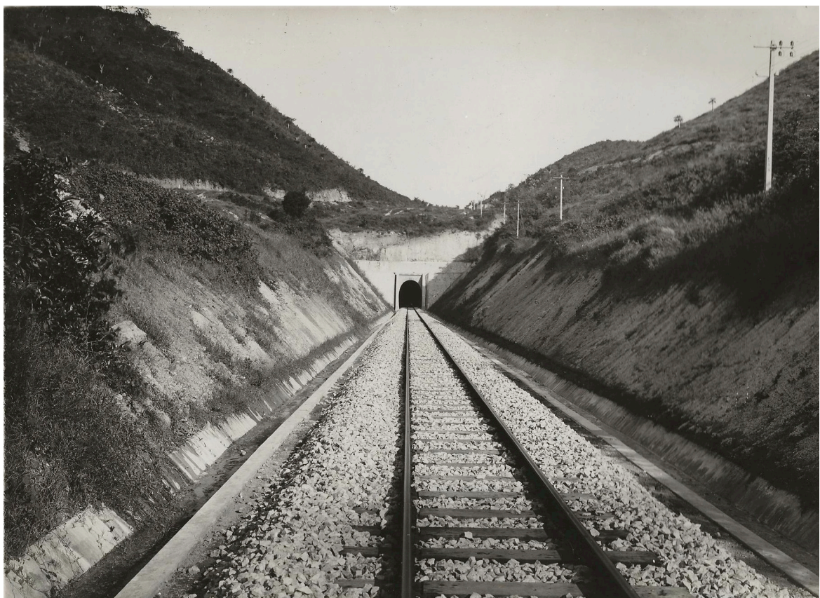
TUNNEL CHI-THANH ENTRÉE DE LA TÊTE NORD