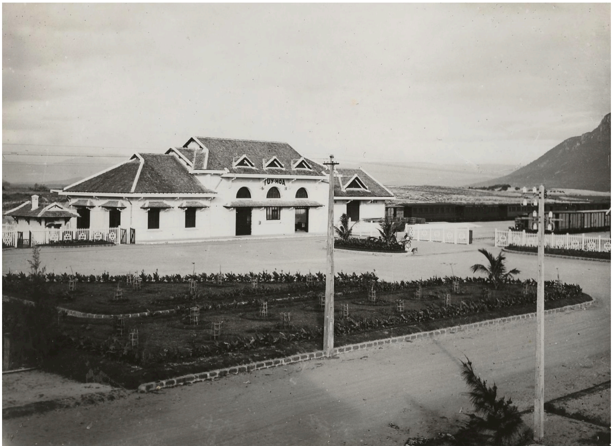
GARE DE TUY-HOA VUE DU CÔTÉ DE LA COUR