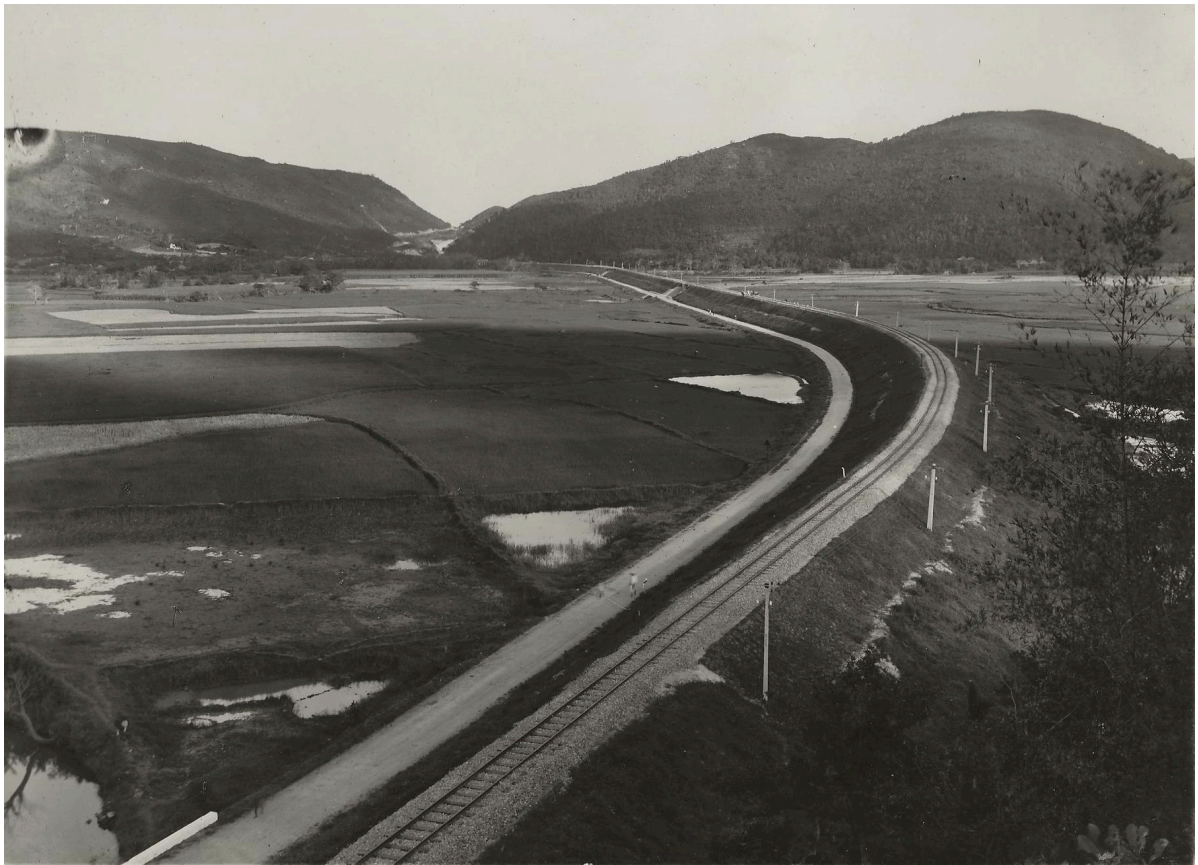
REMBLAI ENTRE BPHONG-NIÊN ET TUNNEL CHI-THANH DU P. K. 146+000 AU P. K. 148+000