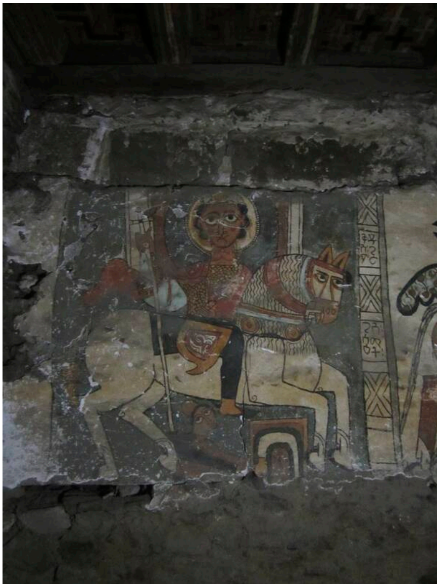
Peinture rupestre de Saint Georges, montagnes de Lalibela

En plein cœur d'Addis, dans le quartier Piazza, s'élève l'église Saint-Georges : après l'église du Palais de Menelik II, elle a été la première église bâtie en ville, à dater de 1895, avant d'être rebâtie entre 1905 et 1911. L'empereur Menelik II a voulu dédier cette église à Saint-Georges en hommage à la victoire qu'il a remportée à Adoua sur les Italiens le 1 er mars 1896, et qui signe l'arrêt des ambitions coloniales italiennes dans la Corne de l'Afrique. Durant les sept années qui ont suivi, soit jusqu'en 1904, de somptueuses célébrations ont eu lieu à la date anniversaire pour commémorer la victoire d'Adoua devant les portes de Saint-Georges. L'église a conservé un lien direct et populaire avec l'empire éthiopien : elle a été le premier mausolée de Menelik II, puis le théâtre du couronnement de l'empereur Haïlé Sélassié le 2 novembre 1930. Ce jour-là est inaugurée la statue équestre de Menelik II sur la place devant l'église : les Italiens ont déboulonné cette statue du vainqueur d'Adoua lors de leur occupation de l'Ethiopie (1936-1941) ; Haïlé Sélassié l'a fait restaurer sur son socle sitôt l'Ethiopie libérée.