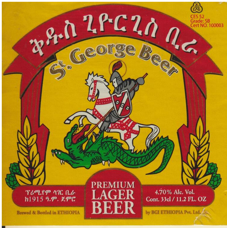
St. George Beer, premium lager beer Brewed and bottled in Ethiopia by BGI Ethiopia Pvt Ltd

En Éthiopie, le plus sûr moyen de vaincre les dragons reste de décapsuler une bière sous les auspices du saint protecteur du pays.