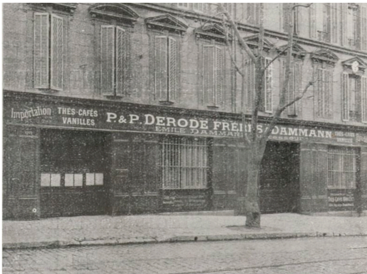
Maison de Marseille, 26, boulevard National

Mais bientôt, il apparut qu'un nouvel et important effort était nécessaire. En effet, depuis quelques années, les planteurs de notre Grande Île ont non seulement développé leurs plantations, mais encore, à force de soins et en s'attachant les préparateurs les plus réputés de la Réunion, ils sont parvenus à produire une vanille qui, dans bien des cas, ne le cède en rien à celles produites dans les autres îles de l'océan Indien. De plus, du fait de son immense superficie, il est facile d'y trouver encore des terrains propres à la culture de la vanille et Madagascar. Du dernier rang qu'elle occupait il y a quinze ans, Madagascar est ainsi parvenue aujourd'hui à tenir la première place parmi les producteurs. Comme il est à craindre que les récoltes de la Réunion et des Comores aient atteint leur maximum, c'est là où est l'avenir et la consommation sera, avant peu, obligée de s'y alimenter.