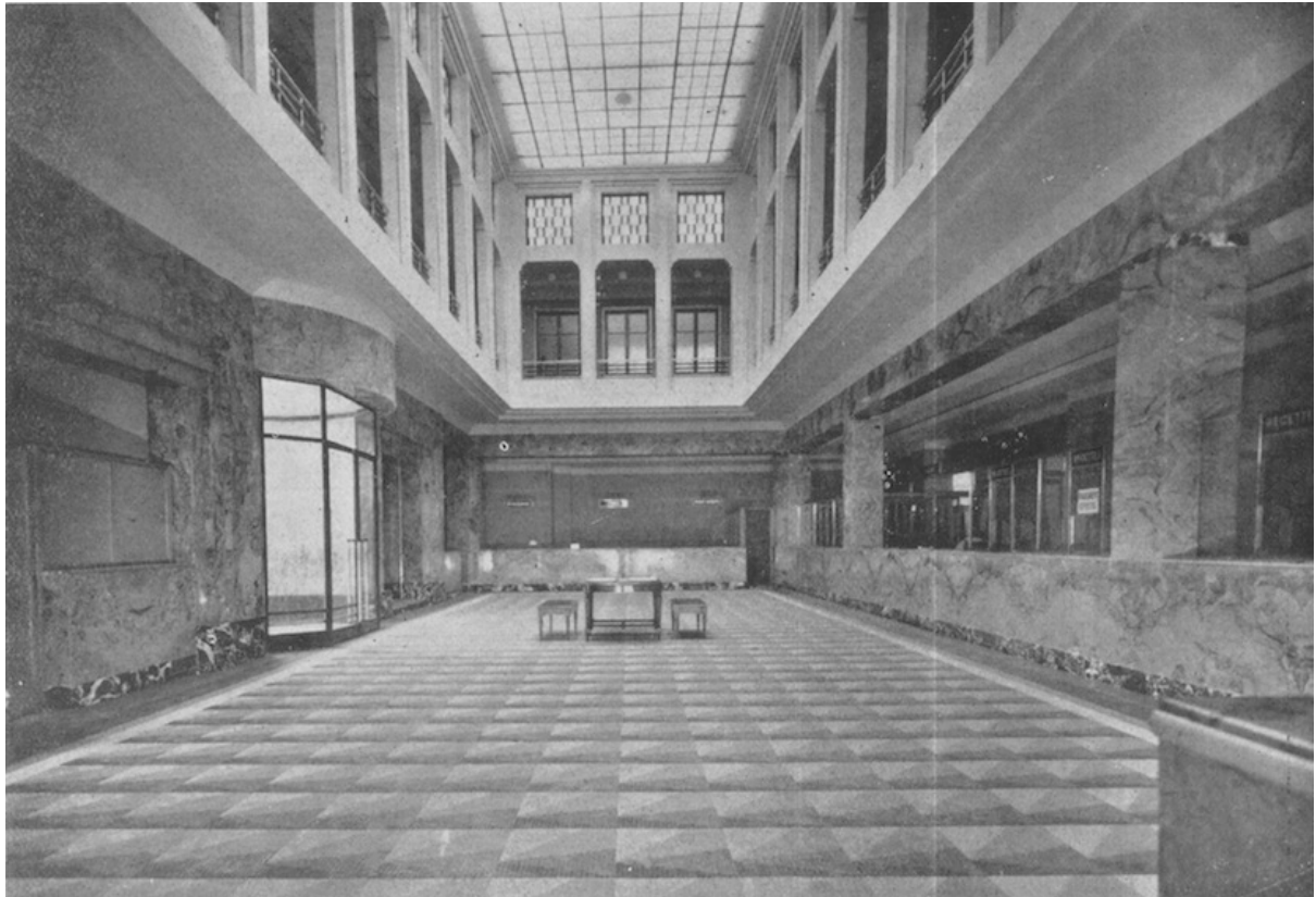
Revêtement de marbre du hall de la Banque commerciale du Maroc, à Casablanca