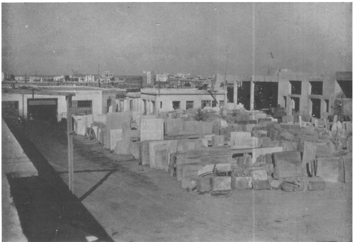
Un coin du parc aux tranches, usine de marbrerie, rue du Colonel-Scal, Casablanca