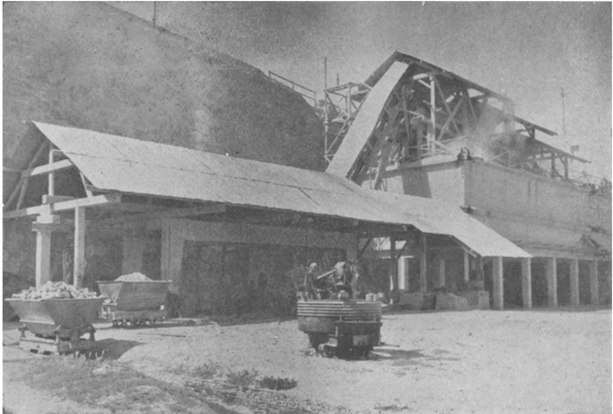
Une installation de broyage de quartzite à El Hank (Casablanca)