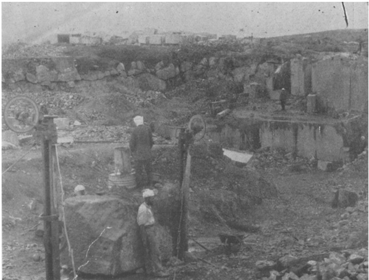
Carrière de marbre noir veiné Khenig de la Société des Carrières marocaines