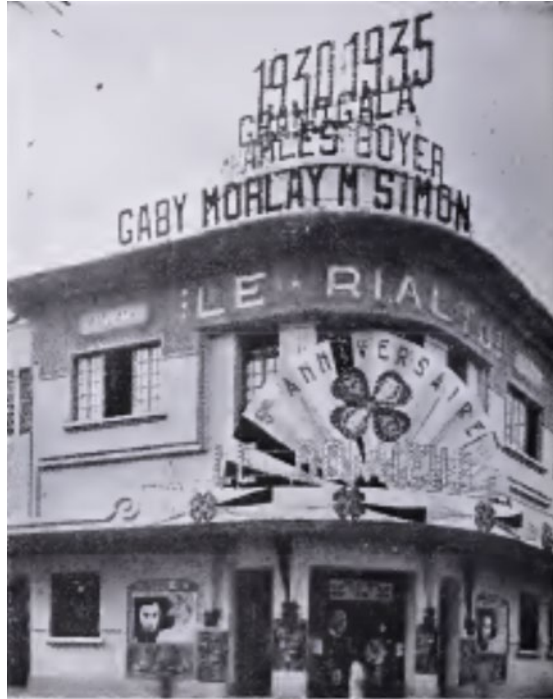
Le Rialto à Casablanca

MM. Gautier et Tosi reprennent l'exploitation du Rialto à Casablanca par Ch. Penz ( La Cinématographie française , n° 930, 29 août 1936, p. 14)