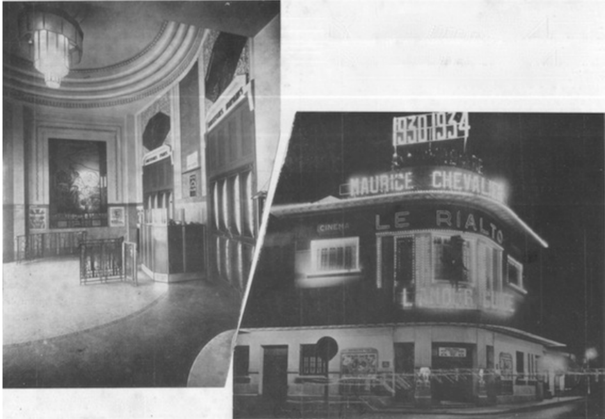
Le hall d'entrée et les guichets

[80] Le cinéma Rialto est la première réalisation somptueuse qui ait été réalisée à Casablanca dans l'industrie du cinéma.