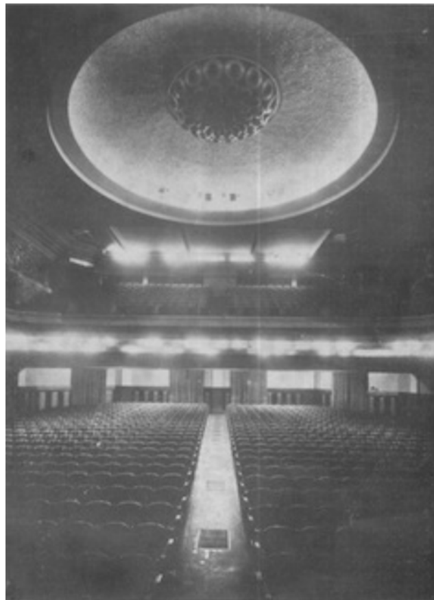
La salle, vue de la scène

En effet, son plateau de 250 m 2 , avec une scène de 10 m. d'ouverture, est