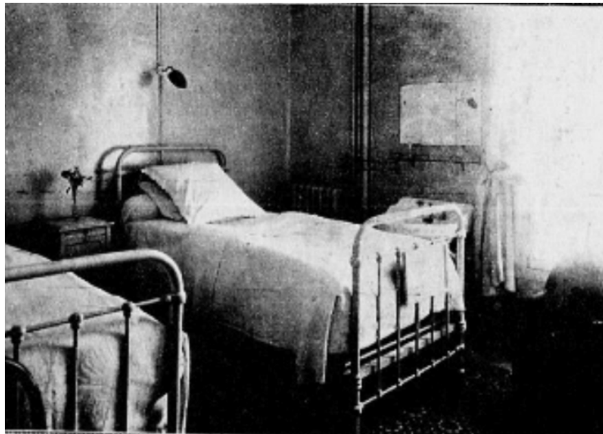
Chambres de malades à deux lits