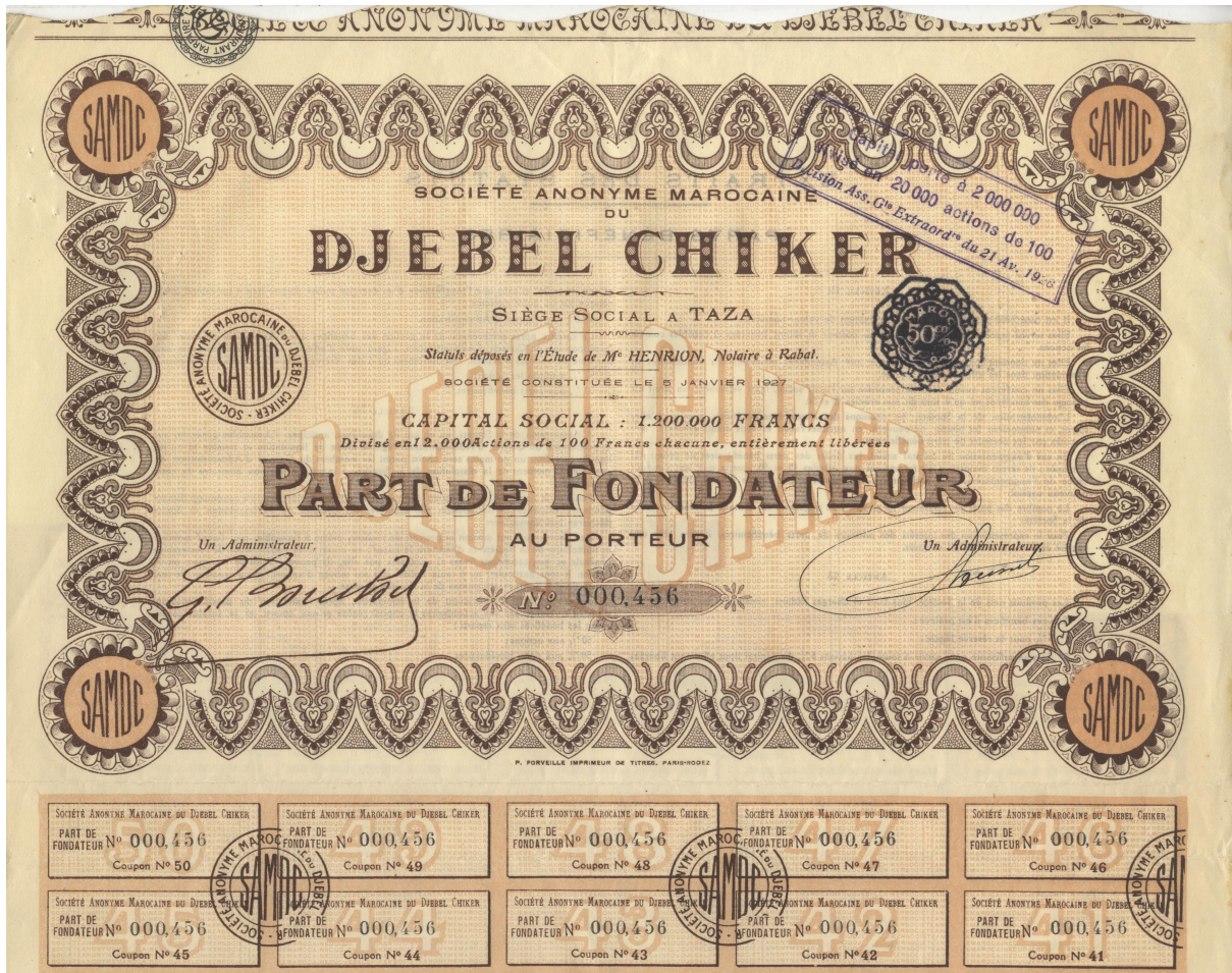
Coll. Serge Volper www.entreprises-coloniales.fr/empire/Coll._Serge_Volper.pdf Idem PART DE FONDATEUR