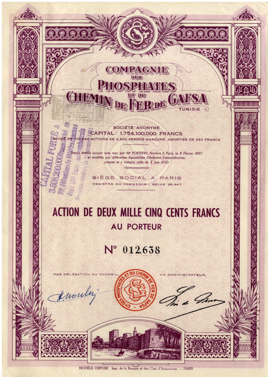
COMPAGNIE DES PHOSPHATES ET DU CHEMIN DE FER DE GAFSA Société anonyme

1951 : Capital porté à 3.508.200.000 fr. par élévation du nominal de 2.500 à 5.000 fr..