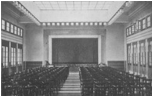
Hôtel Marhaba de Safi, salle des fêtes Hôtel

www.entreprises-coloniales.fr/afrique-du-nord/Paquet_La_Cie.pdf (Édouard SARRAT, Le Maroc en 1938 , Édition de l'Afrique du Nord illustrée, 292 pages, Casablanca, 1938) www.entreprises-coloniales.fr/afrique-du-nord/Sarrat-Maroc_1938.pdf