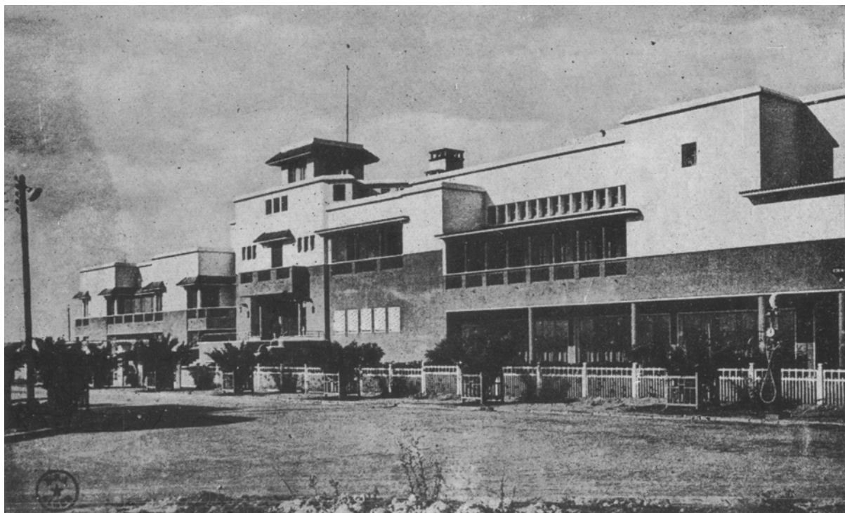
[265] Hôtel Marhaba de Safi