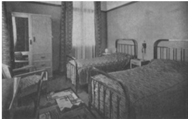
Hôtel Marhaba d'Agadir, une chambre

Le MARHABA de Taroudant, s'il n'est pas aussi important que ceux de Safi et d'Agadir, n'en est pas moins original et sympathique. Aménagé dans une ancienne maison de caïd, il s'élève à l'intérieur des remparts de la vieille capitale du Souss. Rien n'a été modifié dans la disposition des appartements et des jardins. Trois patios se succèdent aussi frais et gracieux les uns que les autres, et rien n'est plus agréable que de vivre au milieu de ces riads parmi les citronniers, les orangers et les bananiers, couverts de leurs beaux fruits écarlates et dorés, et d'entendre le matin de sa confortable chambre, les pépiements joyeux d'une myriade de petits oiseaux.