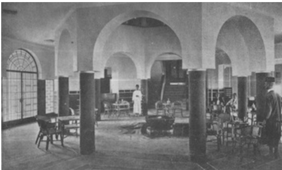
Hôtel Marhaba de Safi, salon de réception

Les MARHABA de Safi et d'Agadir, conçus sur des plans presque semblables, dominent les deux cités de la côte atlantique où ils dressent leur imposante architecture.