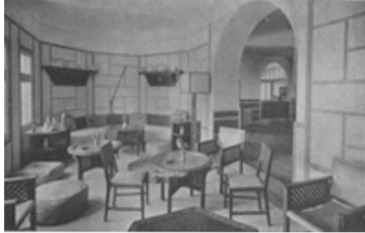
Hôtel Marhaba d'Agadir, salon arabe

La décoration et l'aménagement des intérieurs ont été confiés à des artistes de Rabat : c'est dire que rien n'a été négligé pour flatter agréablement l'œil du touriste. Leurs élégants salons, leurs bars coquets sont larges aérés et disposés en belvédères, en façade sur la mer. Ils font penser à quelque pont d'un navire filant au grand large.