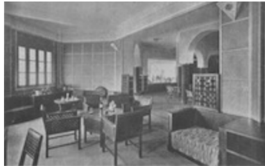
Hôtel Marhaba de Safi, salon arabe

[75] Les hôtels MARHABA, dont le nom en arabe signifie bienvenue , sont de merveilleux gîtes d'étapes pour le voyageur et touriste effectuant le circuit du Sud-Marocain.