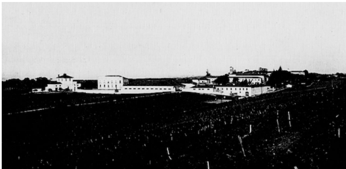
Vue générale des bâtiments d'administration et d'exploitation du groupe Nord

Les origines du domaine. — Le Domaine d'Oulid-Adda, d'une superficie de 722 hectares, propriété de la Société immobilière et agricole de l'Harrach, à Maison-Carrée, s'étend au nord de la localité de Maison-Carrée, près Alger, et sur les bords de l'Harrach.