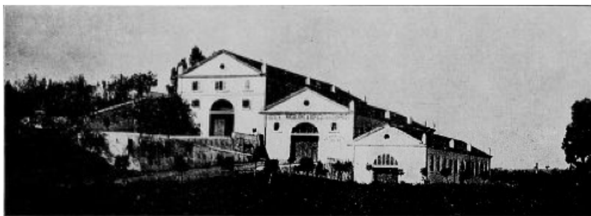
Caves-annexes du domaine d'Oulid-Adda

LES GRANDS DOMAINES EN ALGÉRIE Les vignobles de la Société immobilière et agricole de l'Harrach ( L'Afrique du Nord illustrée , 3 septembre 1910)