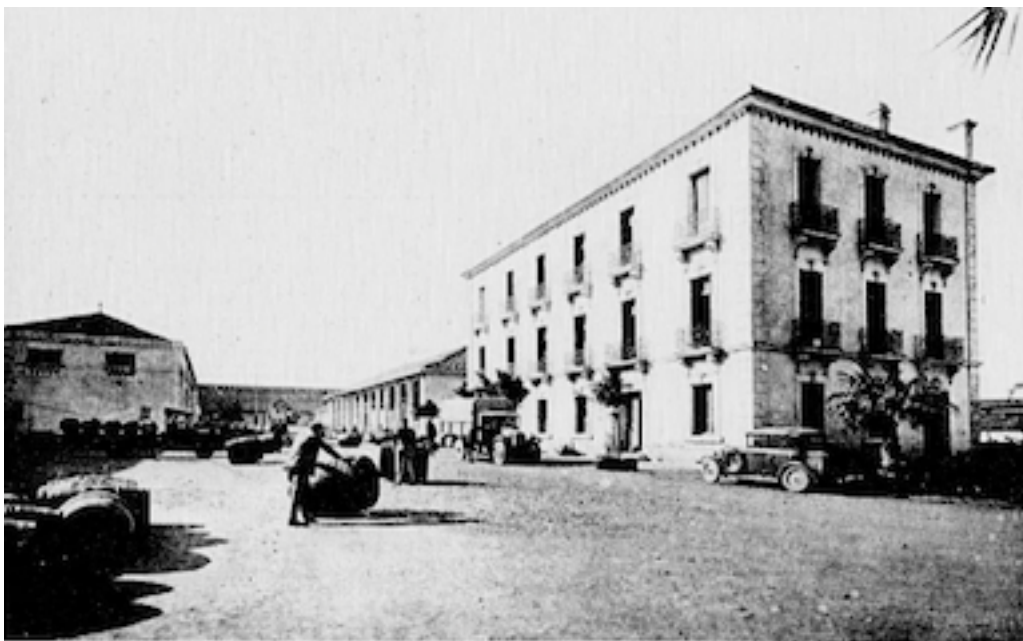
Les bâtiments d'administration des Caves centrales

Le groupe Nord comprend l'installation principale : bâtiments d'administration, cuverie et vinification, chai pouvant contenir plus de 65.000 hectolitres, halls d'emballage et d'expédition, distillerie, logements d'ouvriers, etc.