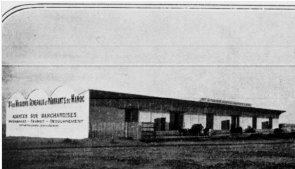
Une des annexes des entrepôts Société des magasins généraux et warrants du Maroc Avances sur marchandises Warrantage — Transit — Dédouanement