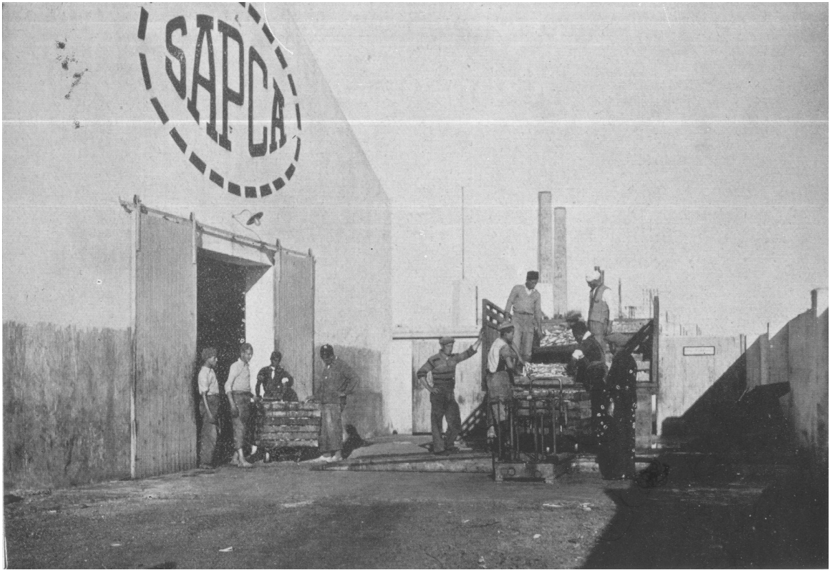
Une expédition de caisses de conserves de sardines

[173] La SAPCA de Casablanca est l'une des plus anciennes fabriques de conserves installées au Maroc.