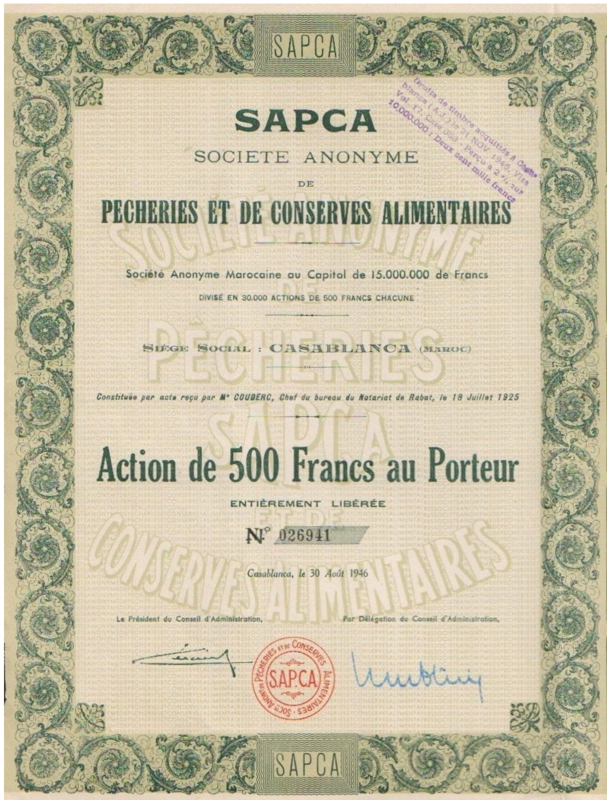
SAPCA SOCIÉTÉ ANONYME DE PÊCHERIES ET CONSERVES ALIMENTAIRES