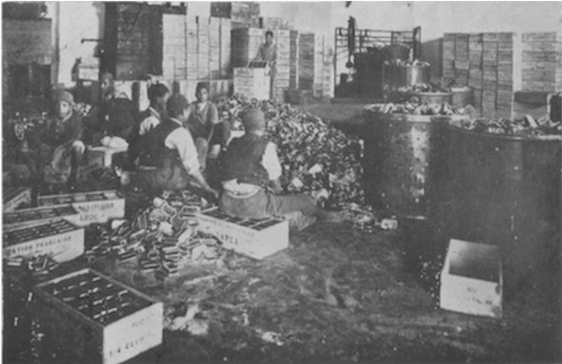
Le travail de la mise en boîte des sardines