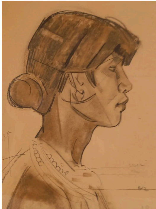
Étude d'homme Moï. Région de Trami. Septembre 1926.

QUELQUES NOUVELLES DE PARIS ( L'Avenir du Tonkin , 16 août 1927, p. 5, col. 4)