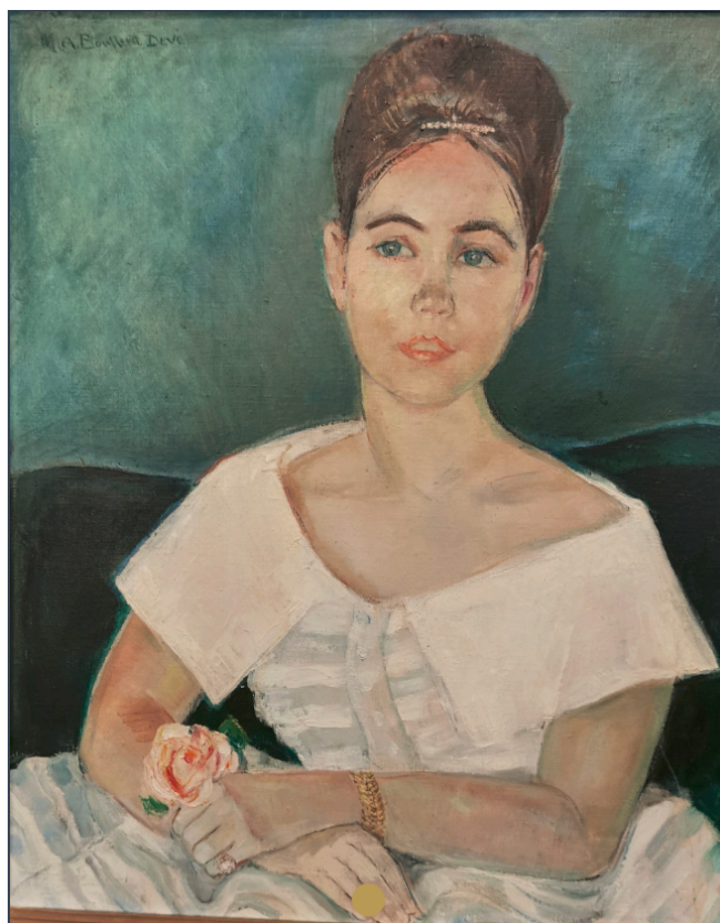
Pour le bal des débutantes 73 x 60