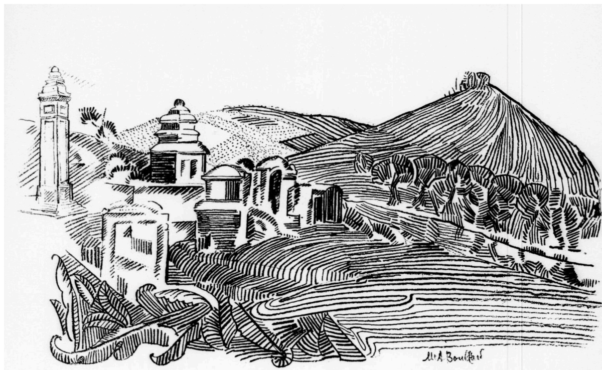
Vues d'Annam par Alfred Meynard Illustrations de M me A. Boullard. ( Extrême-Asie , septembre 1929, p. 277)

[675] UNE vapeur chaude cerne la terre et rend plus lucide le ciel d'un bleu lapidaire ; buée d'un climat sans saison qui emprisonne, comme une gaze, la violence de la lumière, en fait briller doucement le regard sur l'horizon. Un paysage occidental se dégage : verts mamelons posés contre la rivière, qui fuit et reparaît ; forêt de pins uniformément courbés sous la même caresse du vent. La mousse étoffe les rochers ; une eau vivante s'y glisse, invisible et chantante : telle s'exprime, à l'heure qui est la sienne, la campagne de Hué, drapée dans le soleil couchant. Le soir a des transparences d'aurore, un reflet de ces matins de force et de limpidité que le soleil, déclinant ici, apporte à l'autre côté du monde, là où la santé brille dans l'air. Un fugitif instant, on peut se mêler à cette nature, en respirer l'âme étrangère épanouie en de rouges lueurs ; mais bientôt le vide la reprend et détache d'elle notre solitude. Car la mort s'est superposée au paysage, en a fait son domaine, pour y composer une pensive architecture. Les tombeaux n'ont pas demandé aux arbres, aux collines, aux vallons, de les accueillir et de jeter sur eux l'oubli de la vie ; ils se sont substitués à eux, ils leur ont pris leur force, leurs lignes et leurs contours. Maintenant, c'est le paysage qui a la forme des tombes, qui est devenu une sépulture unique et avec une telle harmonie qu'il ne pouvait pas avoir une autre destination.