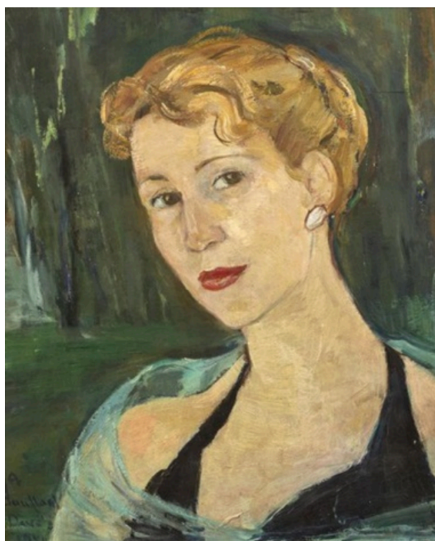
Femme au foulard vert