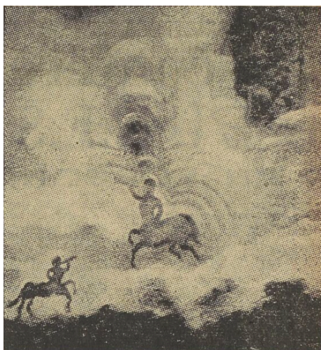
I.-J. BELMONT. Illustration pour le « Boléro » de Maurice Ravel.