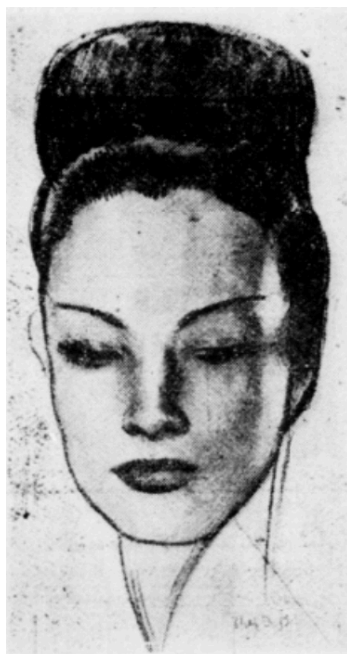
Jeune femme saïgonnaise