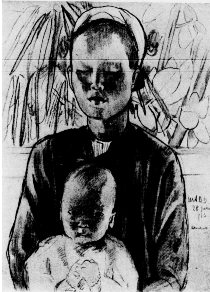
Mère et enfant d'Annam