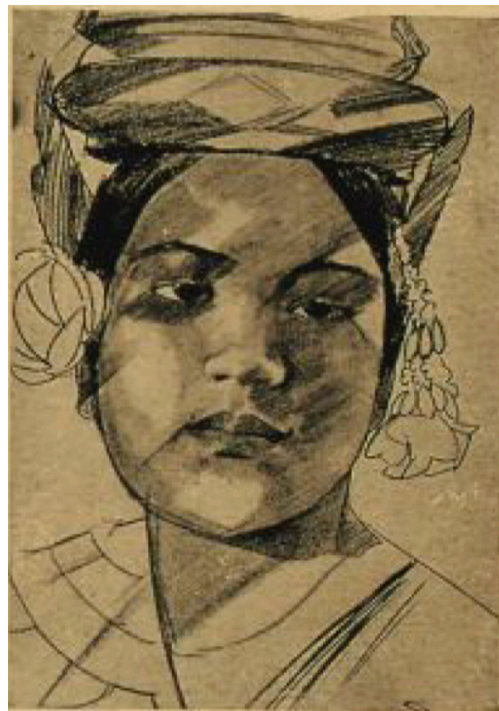
Danseuses cambodgiennes par M me M.-A. Boullard-Devé