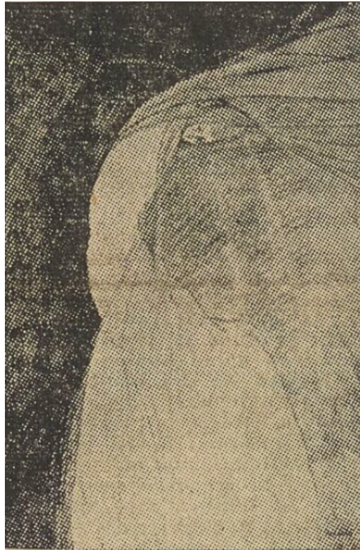
Reine CIMIERE. — Illustration pour. « Ondine »

WALT DISNEY paraissait s'être réservé jusqu'à ce jour la fonction du cerveau qui pense, qui choisit ses thèmes d'inspiration et qui donne la cadence voulue à ses réalisations. Or, il apparaît dans Fantasia que Walt Disney n'arrive même plus à tenir ce rôle.