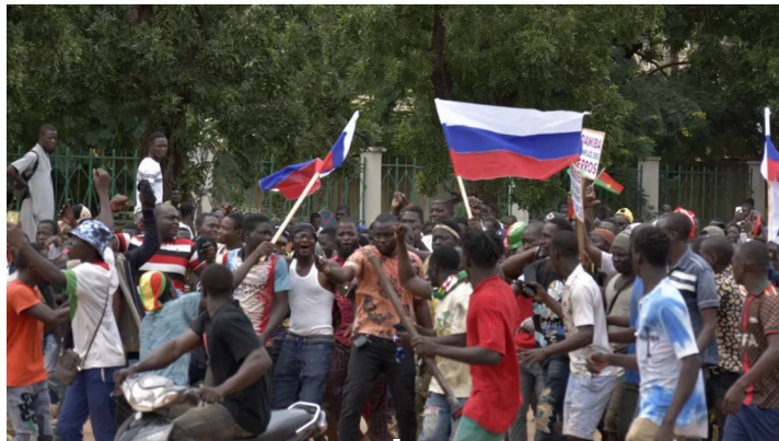
Bande d'abrutis et de stipendiés ayant incendié l'ambassade de France à Bamako (2 oct. 2022) Leur idéal : une armée de criminels asservie à un psychopathe