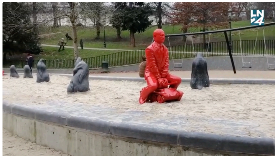
Poutine par James Colomina