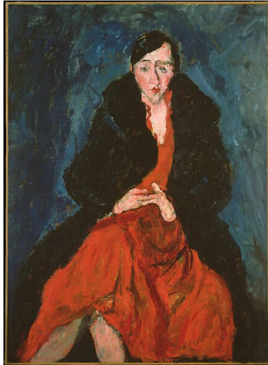
Madeleine Castaing par Chaïm Soutine

SOUTINE, OUI POUTINE, NON GLOIRE À L'UKRAINE