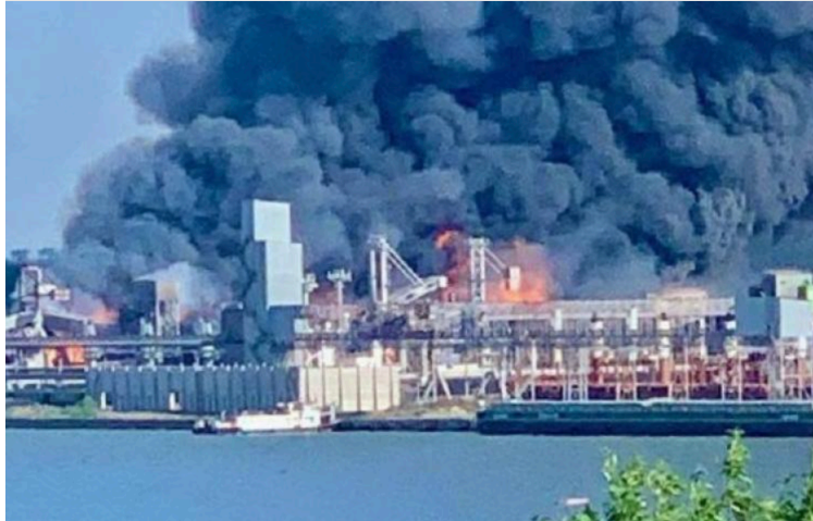
Terminal céréalier de Mykolaïv (7 juin 2022)