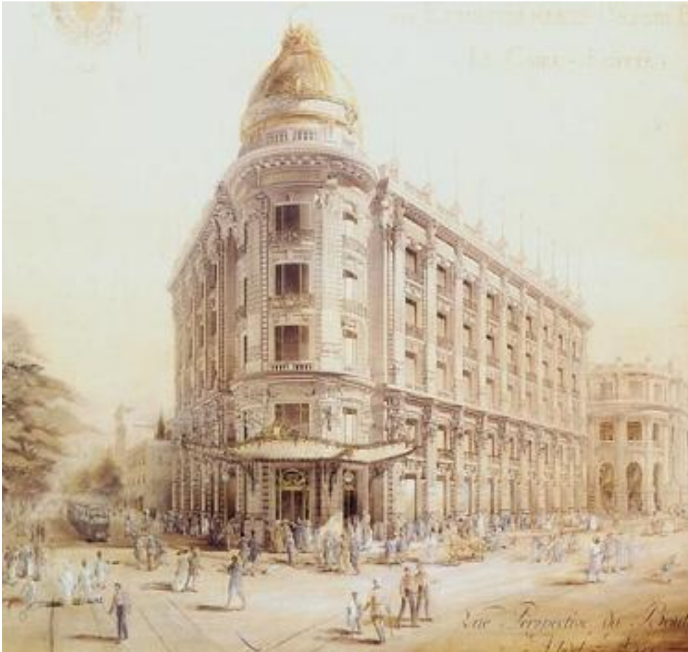
Orosdi-Back au Caire