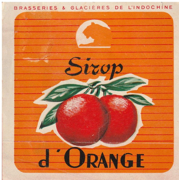
Étiquette sirop d'orange.