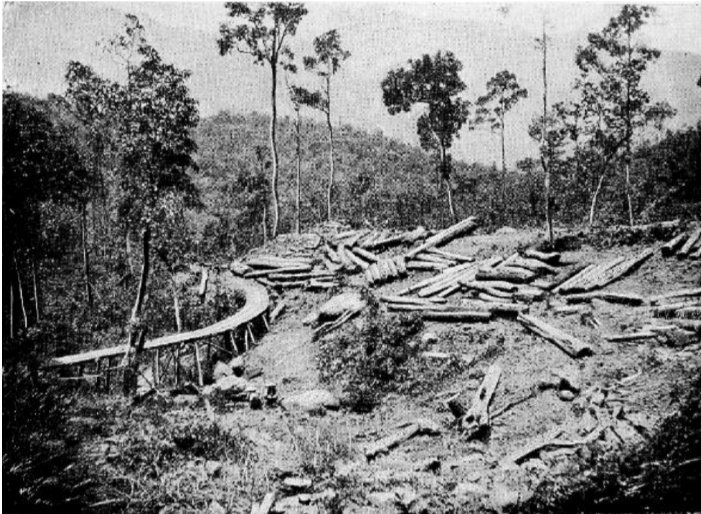
Exploitation forestière de Thua-Luu.

Philippe Eberhardt 1 , Guide de l'Annam , Paris, Challamel, 1914