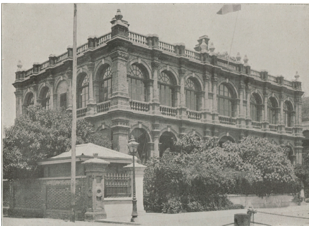
Agence de Hankéou