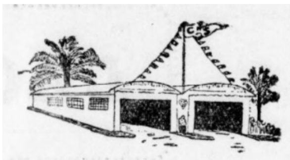
Garages à bateaux

Assemblée générale du 22 janvier 1932 ( Courrier de Saïgon , 23 janvier 1932, p. 3 : résumé) ( Saïgon sportif , 29 janvier 1932, p. 6-7)