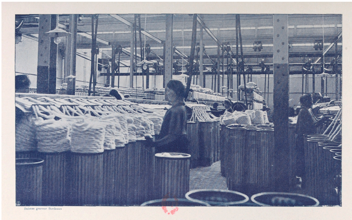
Un atelier (p. 212)

Les produits de la filature se vendent sur place, ne faisant concurrence qu'aux filés des Indes et du Japon. Aucun filé français n'a, en effet, son marché dans notre colonie d'Indo-Chine.