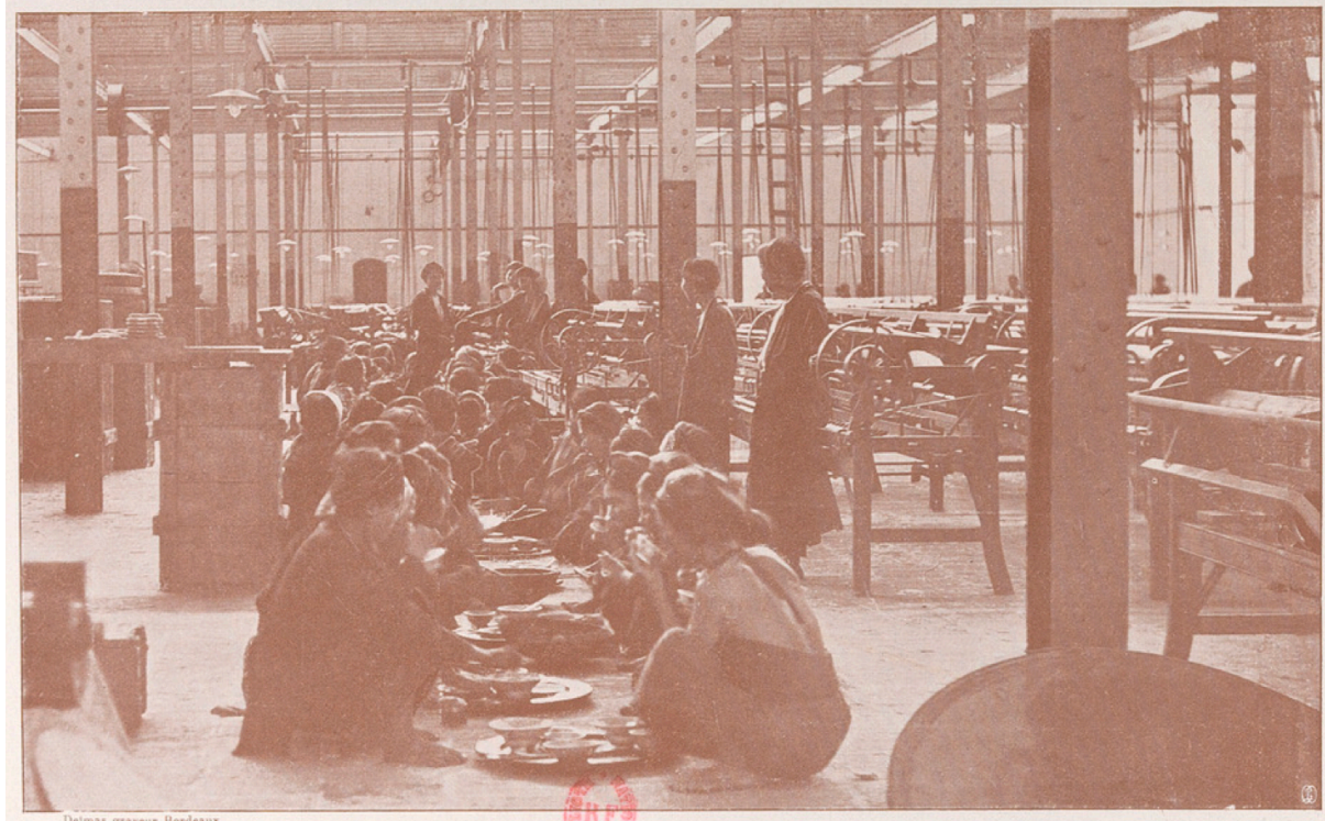
Le repas des ouvrières (p. 214)

La question posée par l'honorable directeur de la filature vaut la peine d'être étudiée de près. Elle le sera, nous en sommes convaincu.