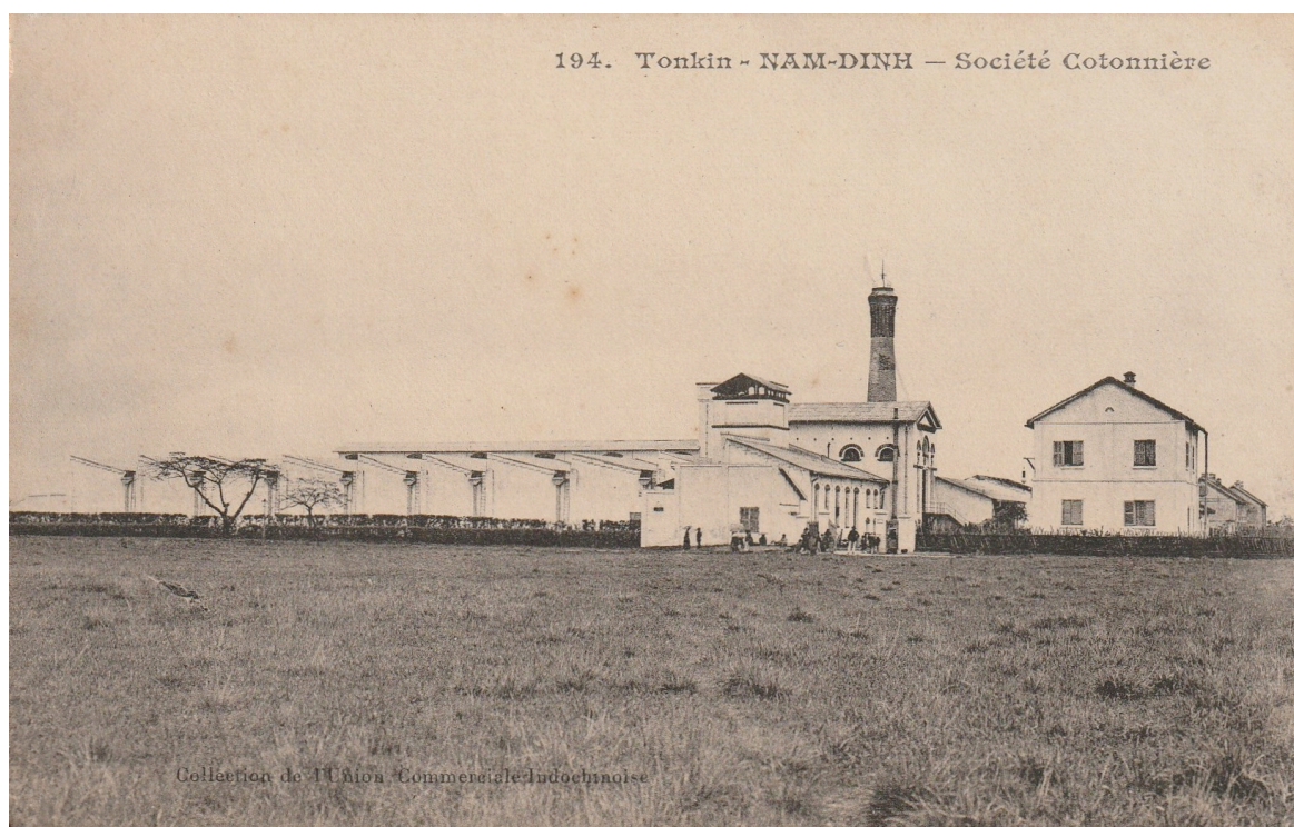
Nam-dinh. — Société cotonnière.