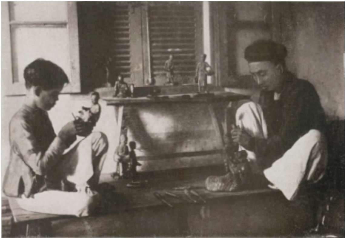
Hadong (Tonkin). — Sculpteur sur bois.