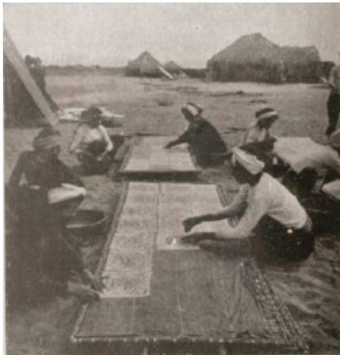
Fabricants de vermicelle