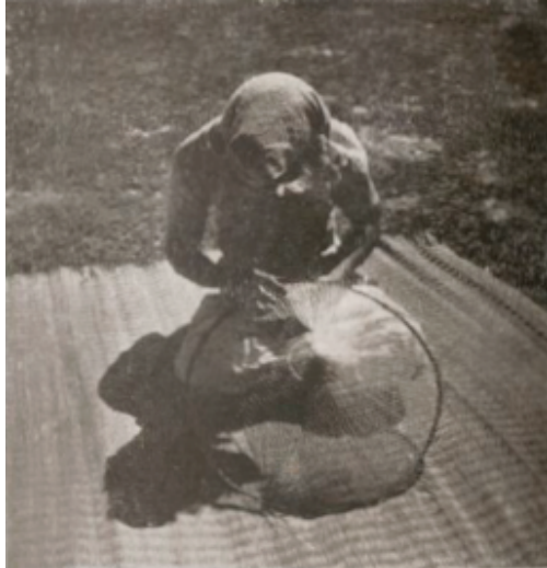
Fabricants de chapeaux. Mise de l'armature