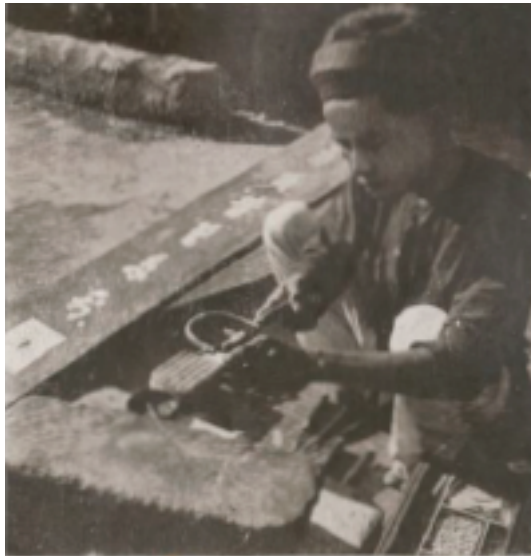
Incrustation de nacre