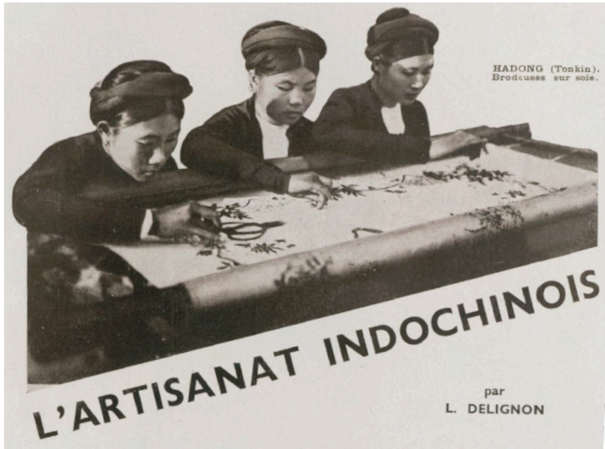
Hadong (Tonkin). Brodeuses sur soie

Mise en ligne : 20 décembre 2018. www.entreprises-coloniales.fr