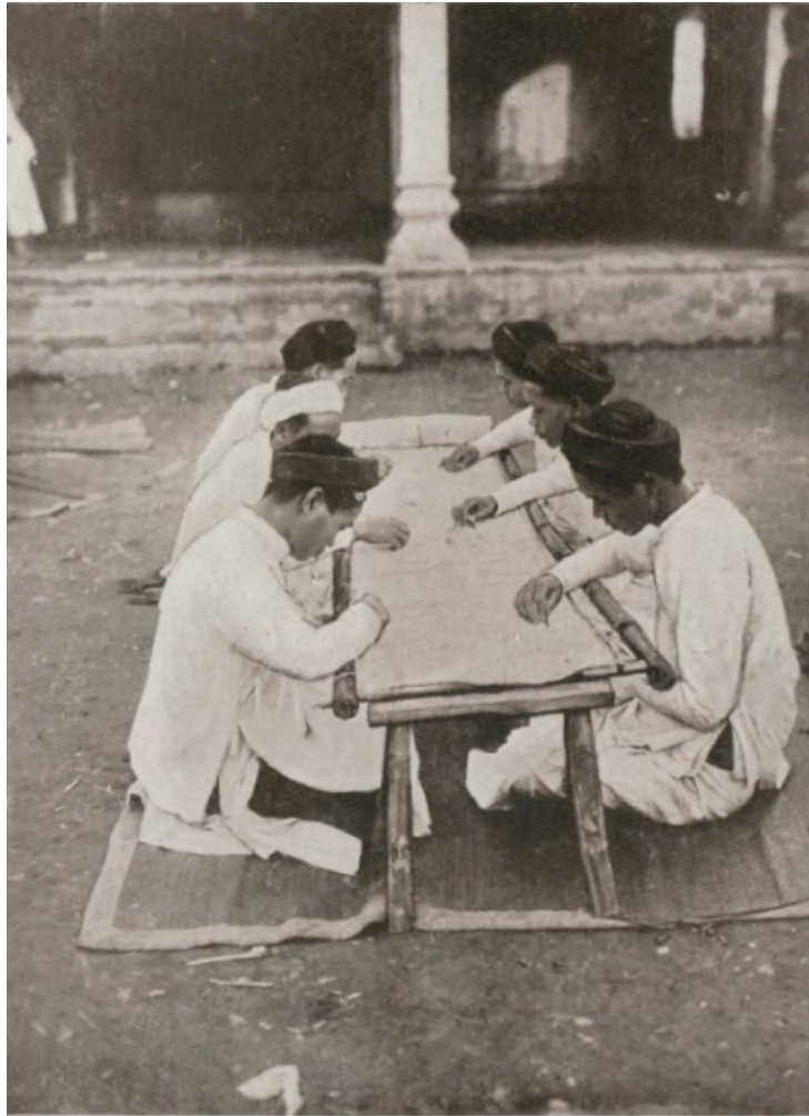
Hadong (Tonkin). Fabrication de dentelles au filet