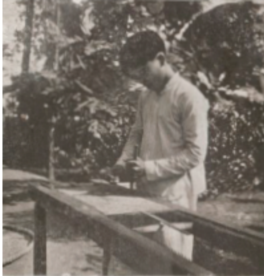
Fabricant de tapis de coco