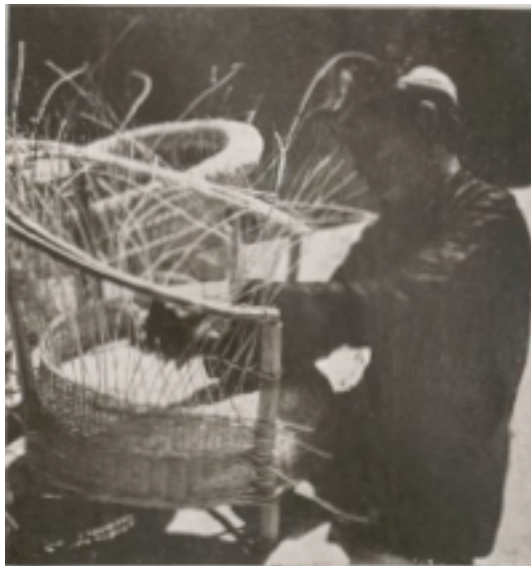
Vannerie de Phu-My