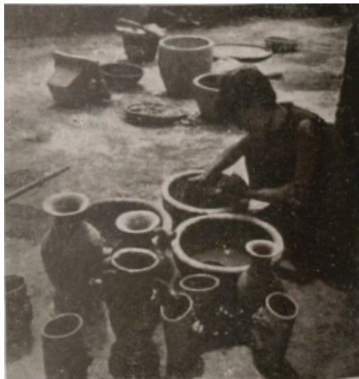
Vernissage de poteries