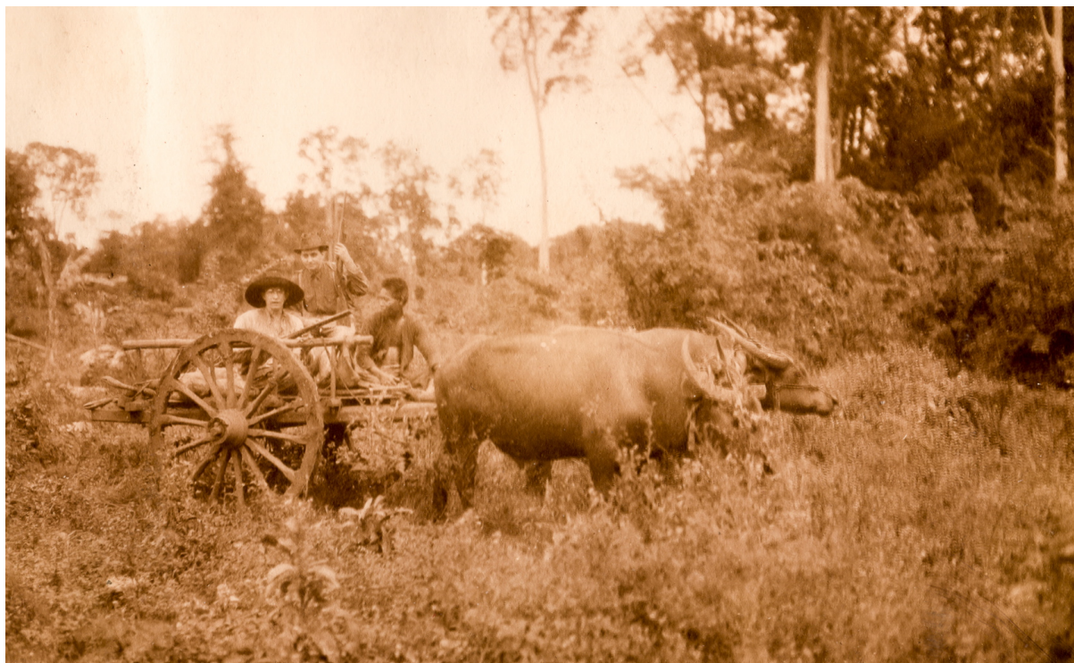
Retour du gibier en charrette