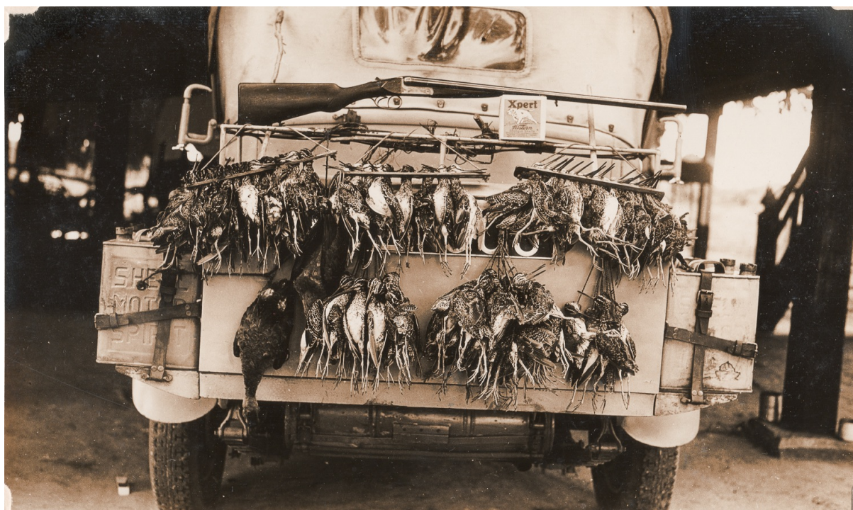
Marius Didier : tableau de chasse (1933)