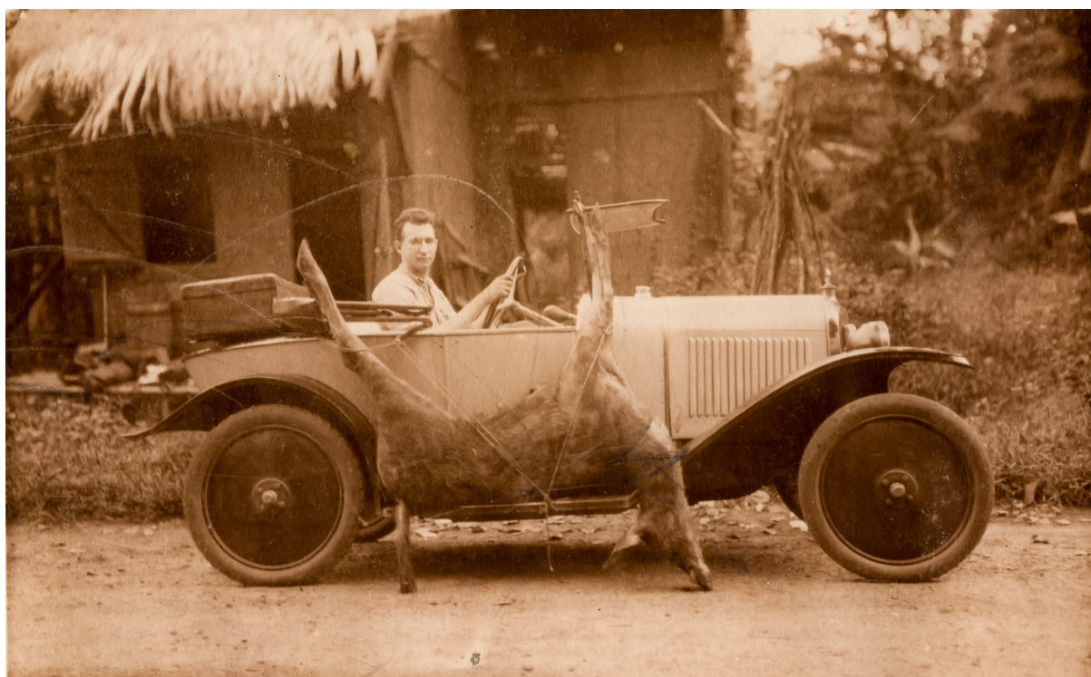
Transport du gibier en voiture