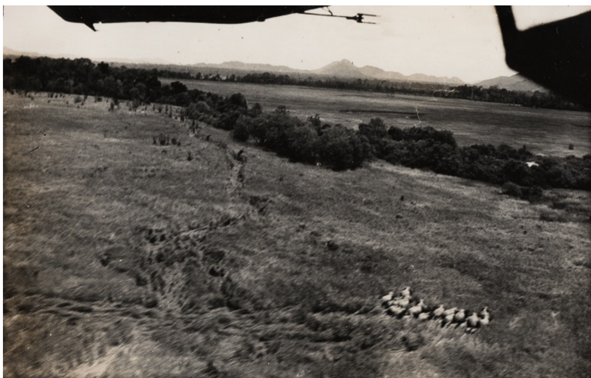
Troupeau d'éléphants dans la Lagna vu d'avion