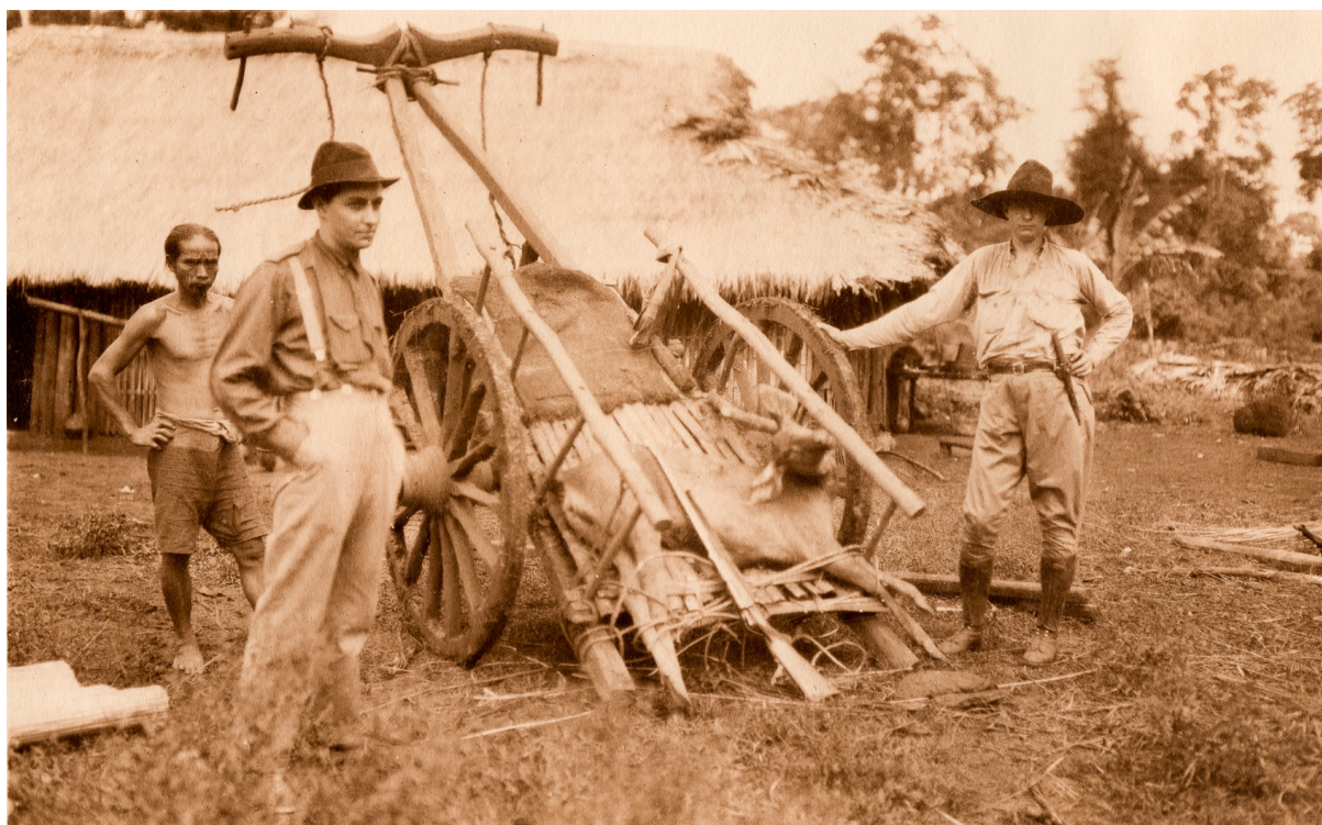
Arrivée du gibier à l'étape