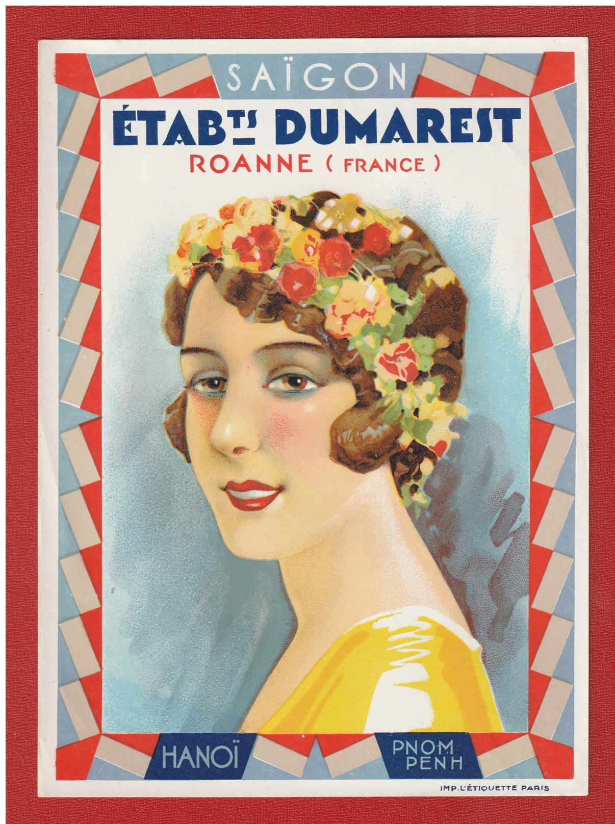
Coll. Olivier Galand ÉTABLS DUMAREST ROANNE (FRANCE) SAIGON - HANOÏ - PNOM-PENH (mais pas encore Haïphong) Imp. l'Étiquette, Paris