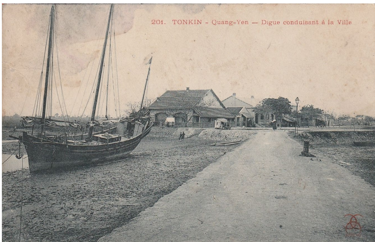
Quang-Yên. — Digue conduisant à la ville(1906)