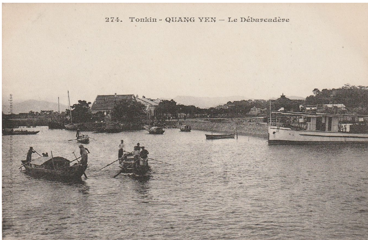
Quang-Yên. — Hôtel Clément, débarcadère