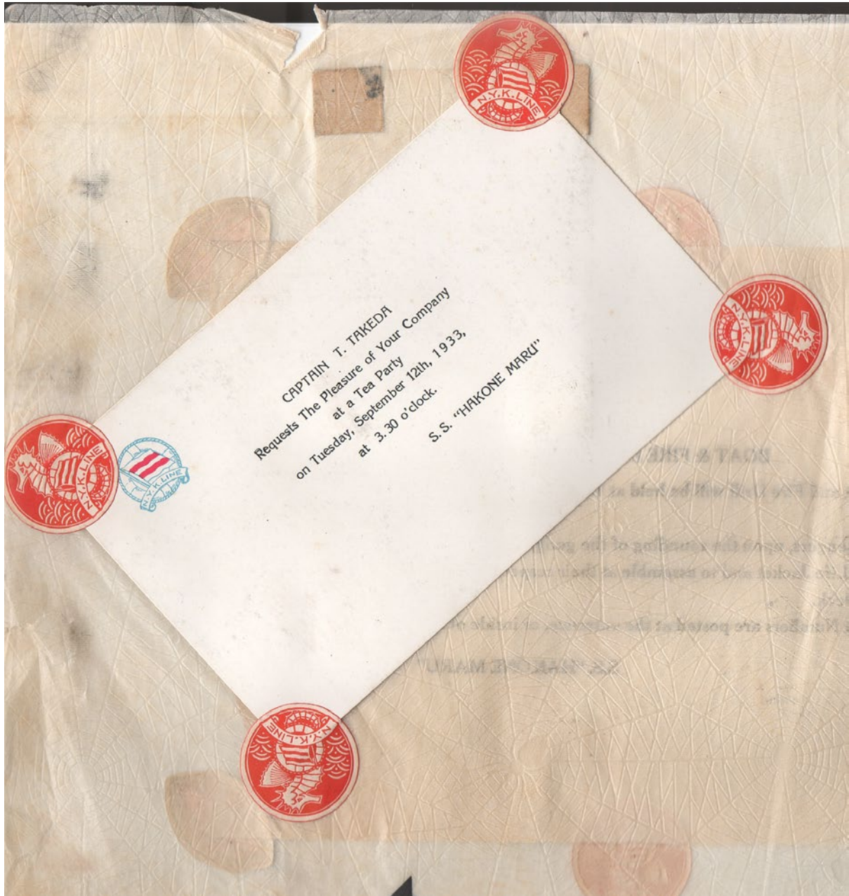
Invitation à une tea party à bord du Hakone-Maru (coll. Anne-Sarah David)