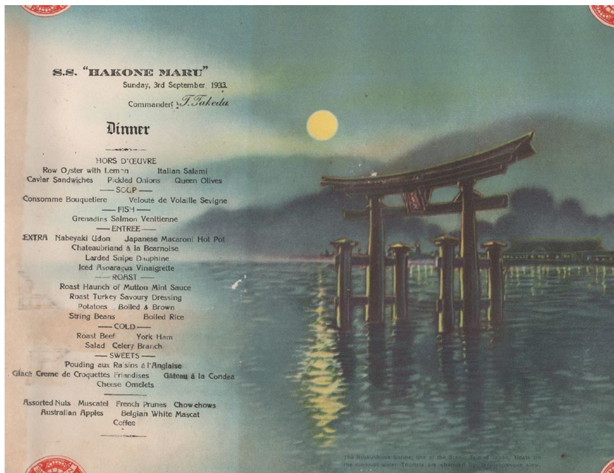
Dîner à bord du Hakone-Maru , 3 septembre 1933