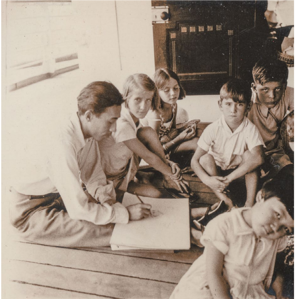
Artiste japonais croquant les enfants (coll. Anne-Sarah David)