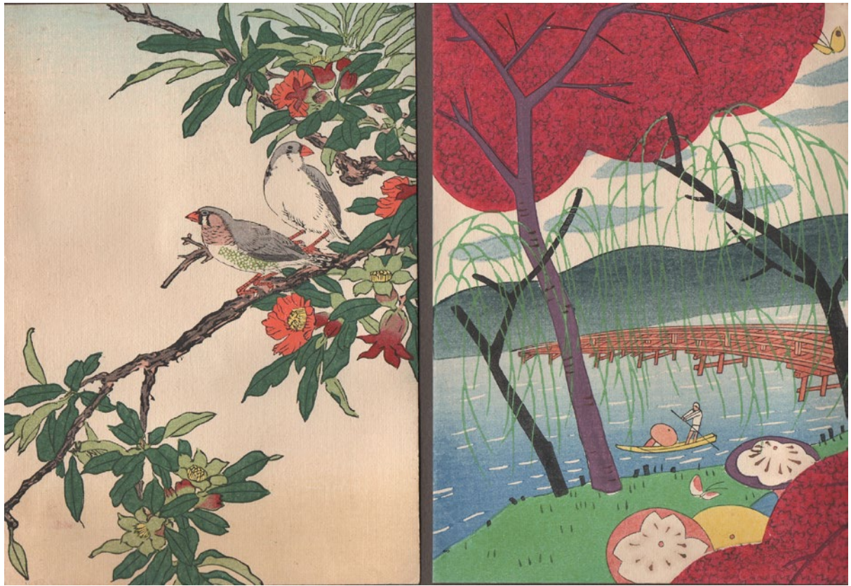
Carte du Hakone-Maru