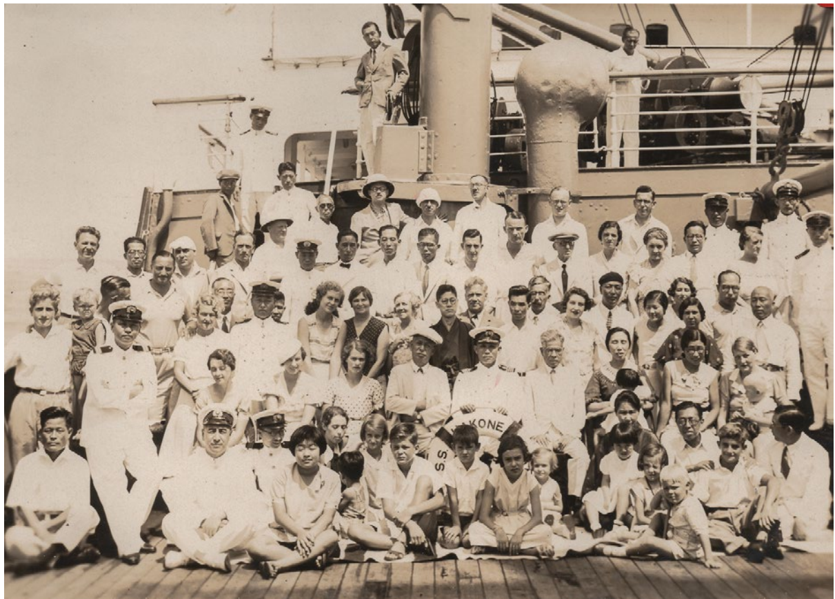
Équipage et passagers du Hakone-Maru