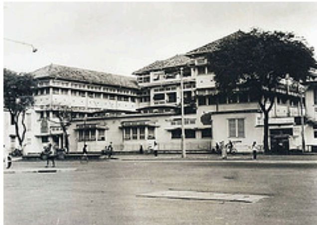
La polyclinique Dejean de la Bâtie (moins le pavillon Hui-Bon-Hoa), de Saïgon, a été construite par les Éts Lamorte.