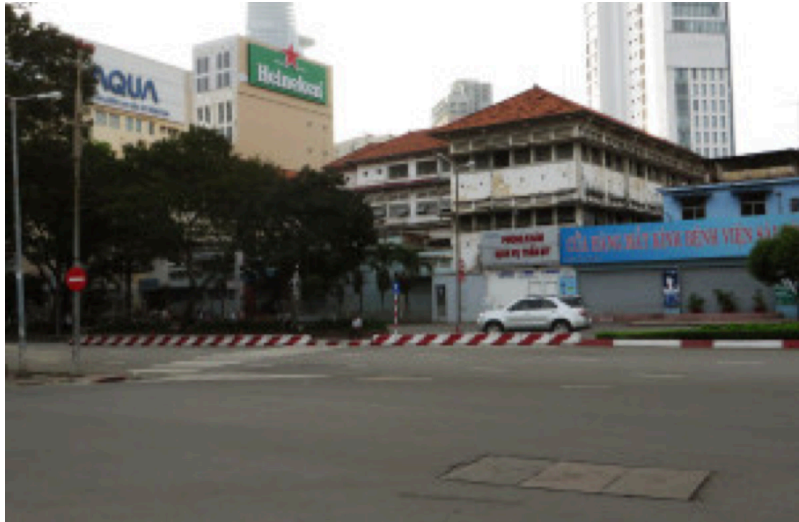
L'Hôpital général de Saïgon aujourd'hui (bd. Lê Loi, Quận 1) (ex-Bonard)