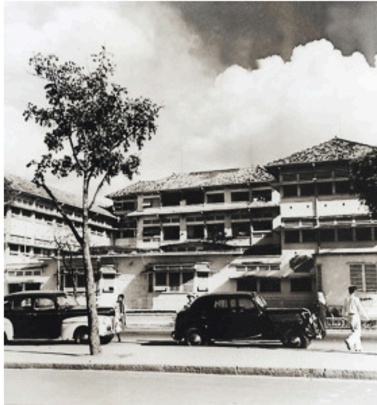
La Polyclinique Dejean de la Bâtie en 1949

Enfin les sœurs de l'Ordre de Saint-Paul de Chartres, qui sont toujours demeurées à leur poste, ont bien mérité de la reconnaissance des autorités et de la polyclinique.