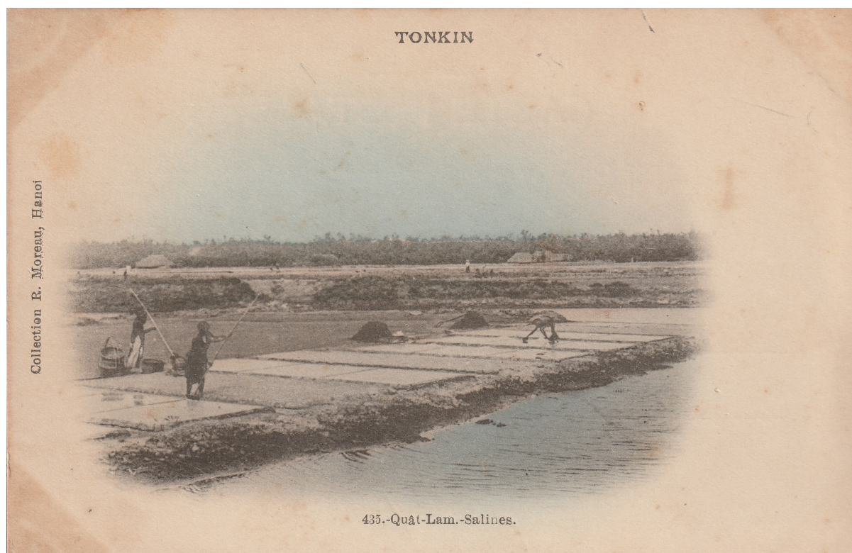
435. Quat-Lâm. — Salines.

..... De là, je passe à Quat-Lâm, y faire, d'accord avec MM. Doumer et Frézouls, des études de fabrication de sel sur salines modernes (1901-1902). J'y laisse des plumes.