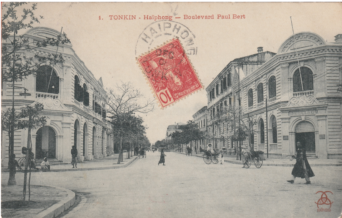
Haiphong. — Boulevard Paul-Bert. À droite, la maison Speidel & C°.