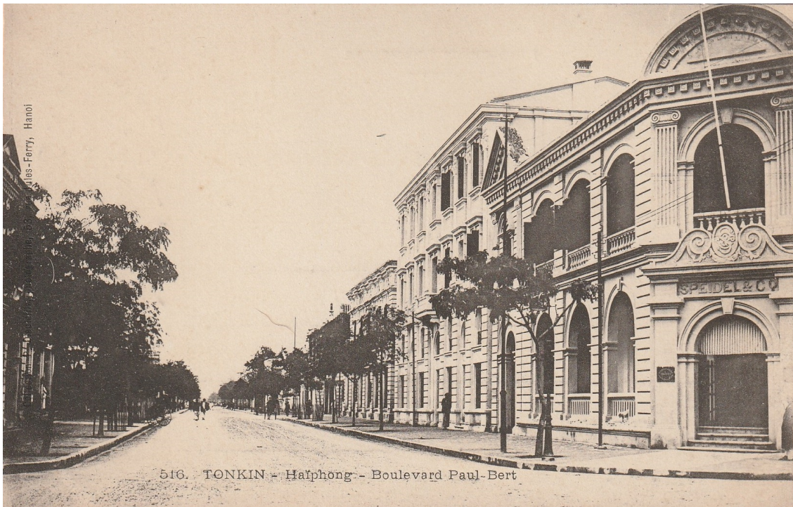
Haiphong. — Boulevard Paul-Bert. À droite, la maison Speidel & C°.